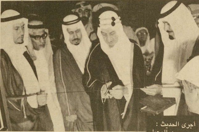
اجرى الحديث: محمد الوعيل

نظري للمسؤولية والحكم .. تتبع من يتبني بان الحكم قيادة وخمسة قيادة للشعب .. وخمسة لعداوتهم العربية العتلة ..