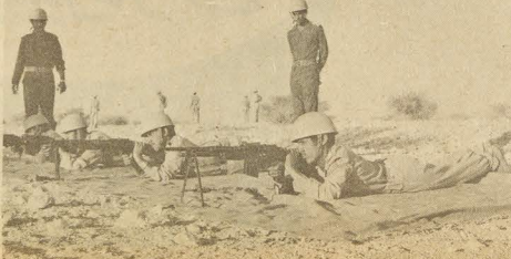
فما بالشايفتي المدارس التي توفر لتجنيد العرس .. والاضافة الى القدرة القتالية المتمايزة ثقافة عامة جيدة .. وساعده على ادراك ميكانيكيتها نظريا وعمليا وتحافظ له في الوقت ذاته على ثقافته الجندى الامين لرسالته والمخلص لوطنه ودينه والمقاتلي في اطاعة مليكته .. وقد اشترطنا على الشركات المتعاقبة مع الحرس الوطني ان تكون قد اعدت من رجال الحرس بالذات جميع المهرج والفنيين لتشغيل وصيانة وادارة جميع المشروعات والاوتوات والعدادات المتاهدا عليها .. وذلك فور انتهائهما من عملها ..

جلالة المغفور له وهو يفتتح ميناسي نادي الحرس الوطني ومدارسه في خشم العمان .. خلال العام الماضي ..