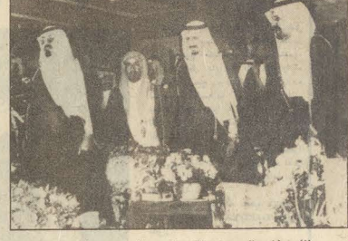
نائب خادم الحرمين والامير عبدالرحمن وسلطان لقعة عزف السلام الملكي