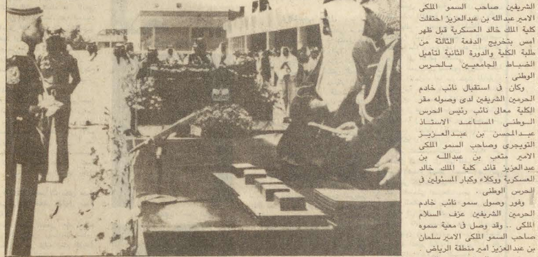
نائب خادم الحرمين يسلم السيف الذهبية لأحد المتفوقين

يا صاحب السمو هذا يومنا - اما غدا وافاق المستقبل امامنا فهي بانين الله واسعة كالامل متحفرة كالطموح ، غنية واعدة بفضل الله من فضل قيادتنا وما يوليه لنا خادم الحرمين الشريفين - حطه الله - وسموكم الكريم من رعاية ومساندة . ان كلية الملك خالد العسكرية مستمرة في اداء واجبها وفق قدرتها الاستيعابية ، ولديها من خطط المستقبل الكثير ، منها خطة تم بموجبها ابتعاث عدد كاف من المعينين للحصول على درجات الدكتوراه ، ومنها الاستمرار في تطوير المناهج وكتب التدريب بحيث تحافظ الكلية على قفزة نوعية متميزة تتسجم مع دور الحرس الوطني التنامي وطبيعة التطورات وبرامج التدريب التي تجري في قطاعاته كلها . يا صاحب السمو استاذكم في ان اخاطب الزلاء الخريجين في هذا اليوم السعيد ، يوم حصاد الخير والثمرات الطيبة . فيا ايها الزلاء ما اتمت اليوم في مرحلة جديدة من الحياة العسكرية والعامة لقد منحتكم قيادتنا نعمتها ، واعطاكم شرف رتبة عالية كريمة ، وجاء دوركم للذل والتضحية والعطاء ، واني بهذه المناسبة اوصيكم ونفسي بتقوى الله ومرافقته في السر والعلن ، فرب ان اصطلح سيرته اصطلح الله تعالى له علايته . ان املنا بكم ان يكون كل واحد منكم حارسا امينا لموقعه ومركزه ، صابرا على كل صعوبات وجديا امام اي عقبات ، قولالا للحق والصدق ، فعالا للواجب في الحرب والسلام . ان ما حصلتم في هذا المرح من العلوم والبركات والتدريب هو مفتاح التلاحق الطويل ، وما من وثيقة ولا مهمة ومستوى تتطلب التعليم المستمر والاتطلاع دائم والتفكير الذاتي الطويل للحياة العسكرية ، واملنا انكم ستستمتعون في التحصيل والتعلم الذوي لربو ليعود ذلك على وطنكم عزه ونصره وعلى كلياتكم ثراء ونفسي ، وعلى وحدتكم تطورا وتقدما .