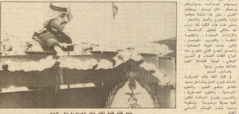
سمو قائد كلية الملك خالد العسكرية يلقى كلمته

القسم الذي لفهم اياه قائد كتيبة الطابوقة ، تل ذلك اعلان ركن التدريب العسكري بالكلية الثالث محمد بن مشهور العزري للنتيجة السامة والتي جاءت على النحو التالي : اول : الدورة الثانية لتأهيل الضباط الجامعيين . ● مدة هذه الدورة ستة دراسية . ● واشترك فيها ثلاثة عشر ضابطا جامعيا من ضباط الحرس الوطني . ● وقد حصل خمسة ضباط على تقدير ممتاز ، وحصل سبعة ضباط على تقدير جيد جدا كما حصل ضابط واحد على تقدير جيد . تانيا : الدورة الثانية والعشرين وهي الدورة الثالثة من طابوقة الكلية الثالثة خالد العسكرية بعد ان اكملوا دراستهم العسكرية والمدنية لمدة ثلاث سنوات . ان عدد الخريجين مائة وواحد وسبعون طالبا عسكريا . وقد حصل اربعة عشر طالبا على تقدير جيد جدا . وحصل ثمانية وستون طالبا على تقدير جيد جدا . وحصل اثنان وثمانون طالبا على تقدير جيد . وحصل سبعة طلاب على تقدير مقبول .