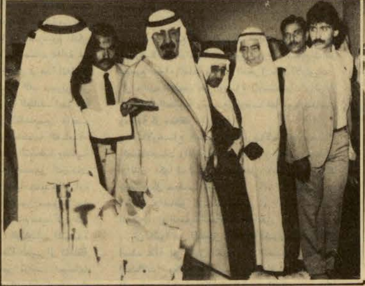
□ وايضا شرح عن جهاز في معرض شركة الكويت للنفط □