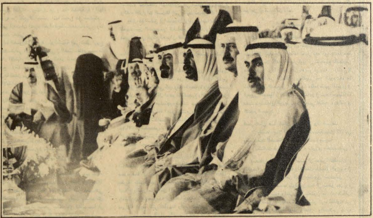
□ الأمير عبد الله وولي عهد الكويت والوزراء يتابعون سباق الخيل الذي اقيم على شرف سموه □