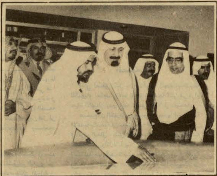
□ في المنشآت النفطية بالإمير عبد الله يستمع إلى شرح عن احد المرافق □