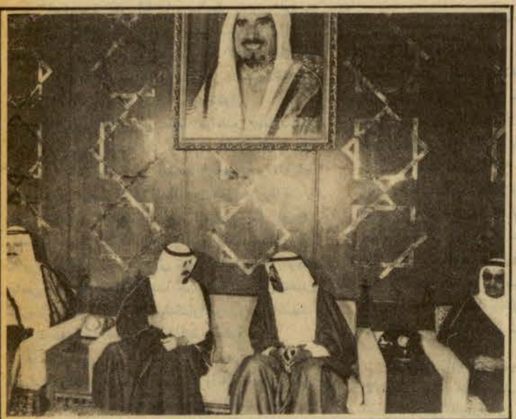
□ الشقيفان في العهد الكويتي والأمير عبد الله في منزل رئيس الحرس الوطني الكويتي قبل مادية الغداء □