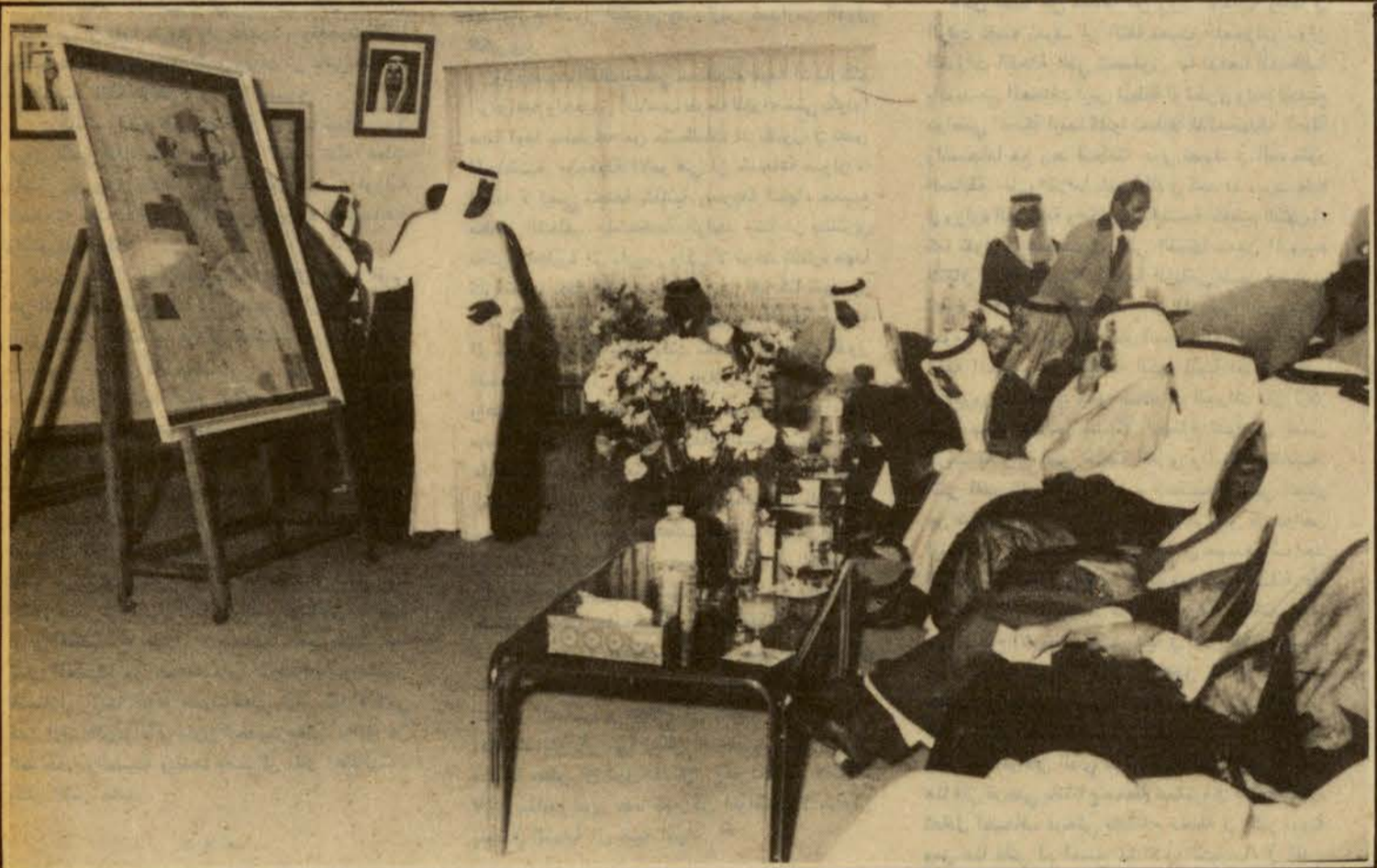
□ في أحد معسكرات الحرس الوطني سموه يستمع إلى شرح عن مرافقها □