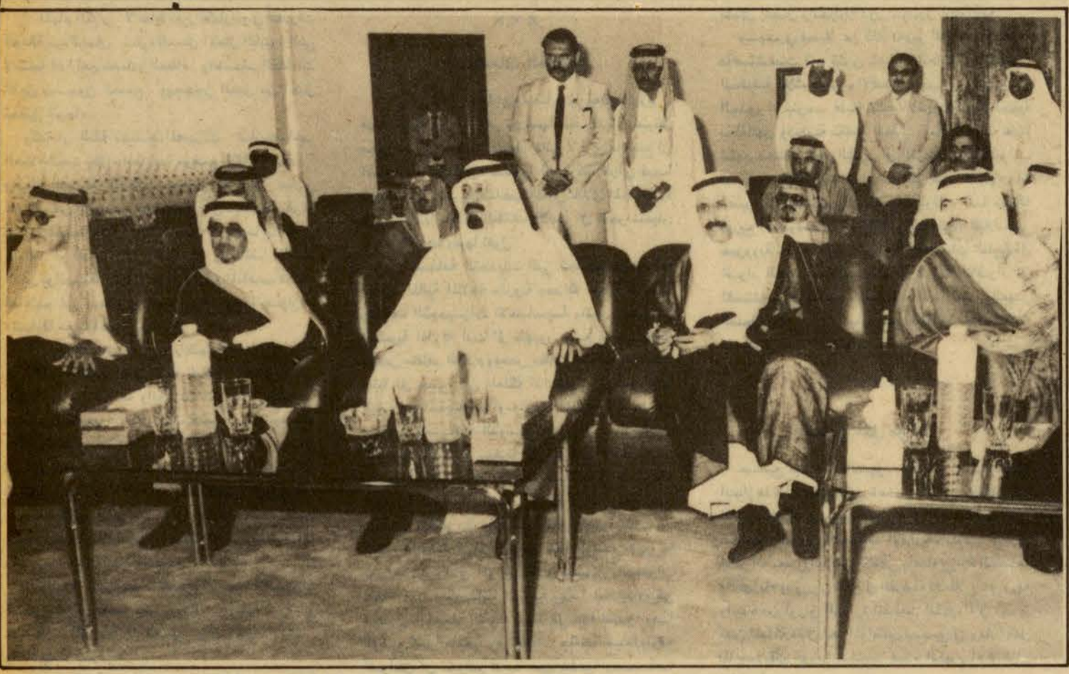
□ سمو الأمير عبد الله ووزير الدفاع الكويتي والوزراء المرافقون يستمعون إلى شرح عن المنشآت العسكرية الدفاعية □

تصان من ووحدة قوات الخليج العربي هي السبيل الوحيد للذود عن حياض أوطانهم