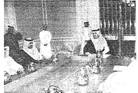
امير حائل يترأس الاجتماع