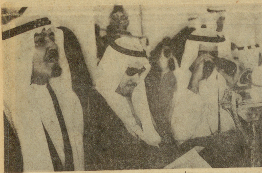
الأمير عبد الله أتم السباق ويجواره الأراء بدر وسلطان