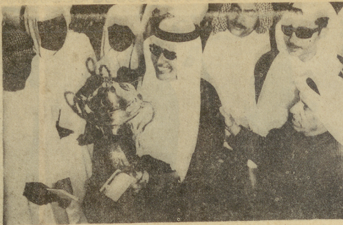
الأمير فيصل بن خالد الفائز بأكبر جائزة في السباق يسمى الكاس