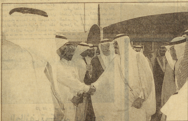
الامير عبدالله يصافح مستقبلياً

بعد ذلك قدم معالي وزير الصناعة والكهرباء لصاحب السمو الملكي الأمير عبدالله بن عبدالعزيز هدية تذكارية بهذه المناسبة عبارة عن مصور جغرافي نادر تم رسمه في القرن العاشر الهجري عام 958 هـ عبارة عن صورة البلاد الإسلامية بالنسبة إلى مكة المكرمة. عقب ذلك تفصل صاحب السمو الملكي الأمير عبدالله بن عبدالعزيز ولي العهد ونائب رئيس مجلس الوزراء ورئيس الحرس الوطني بوضع حجر الأساس قائلاً: بسم الله وعلى بركة الله - اللهم اجعل فيه الخير والبركة لخدمة الدين والوطن والشعب السعودي وخدمة مكة المكرمة والمدينة المنورة. ثم شرف سموه حفل الغداء الذي اقيم بهذه المناسبة تكريماً لسموه. وفي نهاية الحفل عزف السلام الملكي ثم غادر سمو ولي العهد مقر الحفل متوجهاً بجس ما استقبل به من حفاوة وتكريم. وحضر الحفل الخطابي وحفل الغداء صاحب السمو الملكي الأمير سلطان بن عبدالعزيز النائب الثاني لرئيس مجلس الوزراء ووزير الدفاع والطيران والمفتش العام وصاحب السمو الملكي الأمير فهد بن محمد بن عبدالعزيز وصاحب السمو