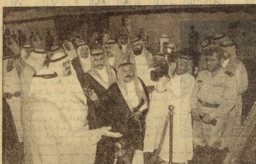
سموه يستمع الى شرح عن المشروع