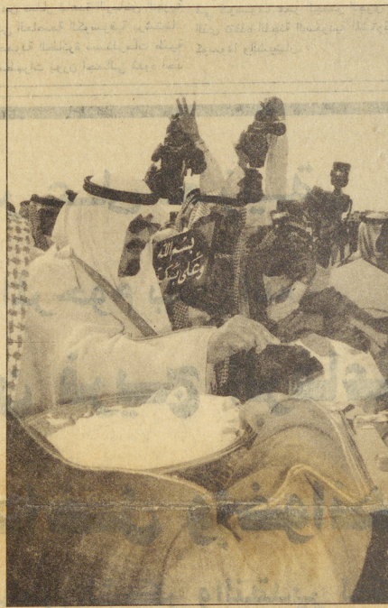
سموه يضع حجر الأساس

وقد كان في استقبال سموه لدى وصوله مقر الحفل صاحب السمو الملكي الأمير سلمان بن عبدالعزيز النائب الثاني لرئيس مجلس الوزراء ووزير الدفاع والطيران والمفتش العام وصاحب السمو الملكي الأمير عبدالجديد بن عبدالعزيز أمير منطقة مكة المكرمة وصاحب السمو الملكي الأمير فيصل بن ثامر بن عبدالعزيز وكيل أمانة منطقة مكة المكرمة للشؤون الأمنية وصاحب السمو الملكي الأمير مشعل بن ماجد بن عبدالعزيز محافظ محافظة جدة ومعالى وزير الصناعة والكهرباء ورئيس مجلس إدارة الشركة السعودية للكهرباء الدكتور هاشم بن عبدالله يعانى والرئيس التنفيذي للشركة لسعودية للكهرباء سليمان بن عبدالله القاضي وأعضاء مجلس إدارة الشركة وفور وصول سمو ولي العهد عزف السلام الملكي. وبعد أن أخذ سموه مكانه في منصة الرئيسة بدئ الحفل الخطابي بآيات من القرآن الكريم. ثم قدم مدير عام الشركة السعودية للكهرباء بالمنطقة الغربية الدكتور بكر بن عمرة خشيتم عرضاً شاملاً عن مكونات المشروع وبأسطة الشرائح الفنية (السلامات) والتي تبلغ تكلفته ستة آلاف وخمسمائة مليون ريال ويشتمل على إنشاء محطة جديدة لتوليد الطاقة الكهربائية مؤلفة من ثلاث وحدات بخارية قدرتها الإجمالية 102 ميجاوات إضافة إلى نظام التبريد بمياه البحر والتجهيزات التكميلية المساعدة للمحطة ومن أهمها وحدات التحلية والمعالجة وتخزين المياه بواسطة أربعة خزانات وفود خام سع كل منها 100 ألف متر مكعب مع نظام ضخ ومعالجة الورد. ويشتمل المشروع على أنظمة التحكم والتشغيل لمرافق المحطة وبرنامج نظام التحكم الرئيسي ووحدات التوليد التي يخطط لاستكمال المشروع على محطة للتحويل رئيسية قدرتها 380 كيلو فولت.