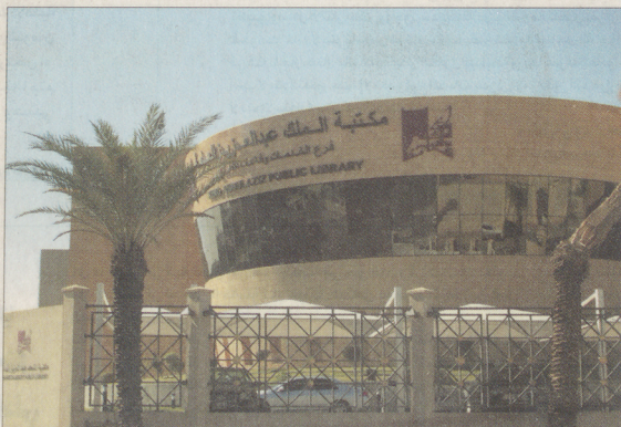
فرع مكتبة الملك عبد العزيز العامة الذي يفتتح اليوم في الرياض.

فرع مكتبة الملك عبد العزيز.. جودة وتقنية عالمية