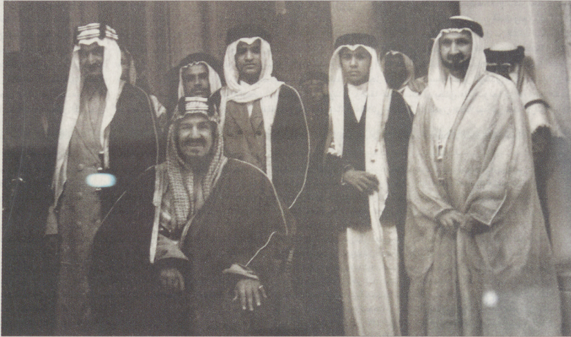
الملك المؤسس عبد العزيز بن عبد الرحمن متوسطا أبناءه الملوك والأمراء.