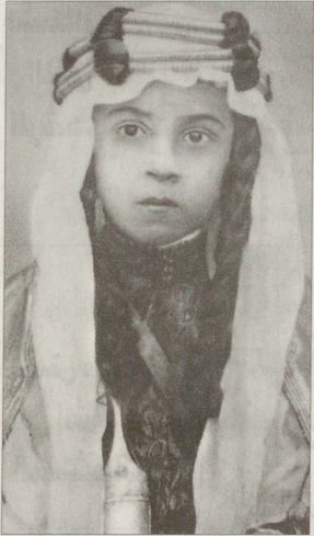
خادم الحرمين الشريفين في صبا.