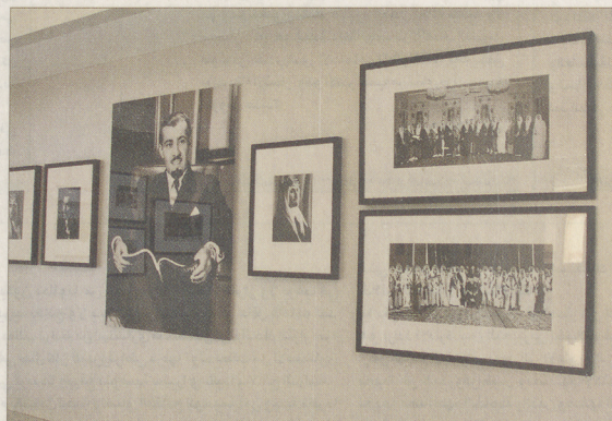
معرض «عبد الله» لصور خادم الحرمين الشريفين في الرياض كما بدأ أمس.

بالإضافة إلى دراسة المملكة بوصفها كلا متكاملًا باتساع مساحتها وتراسمي أطرافها