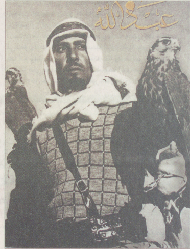
الملك عبد الله في إحدى رحلات الصيد.