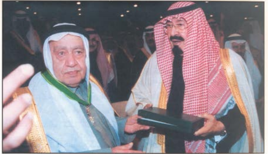
سمو ولي العهد يكرم الأديب والشاعر الجشي

كما تطرق إلى أهمية المحور الأساسي المطروح على رأس قائمة المهام والأنشطة