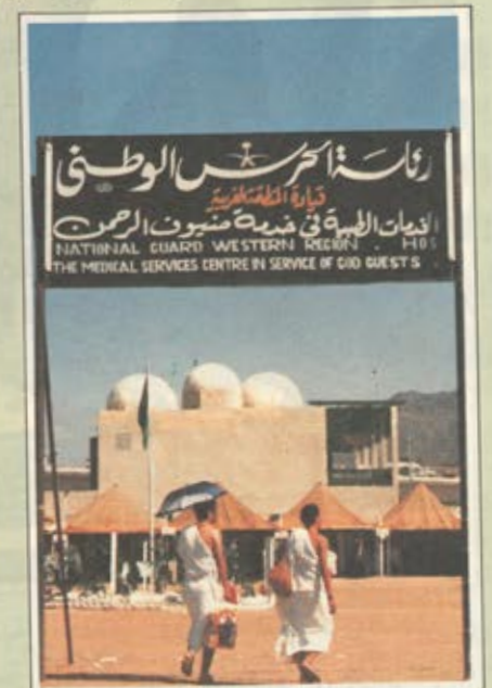
المستشغي الميداني الذي يقيمه الحسرس الوطني بمني