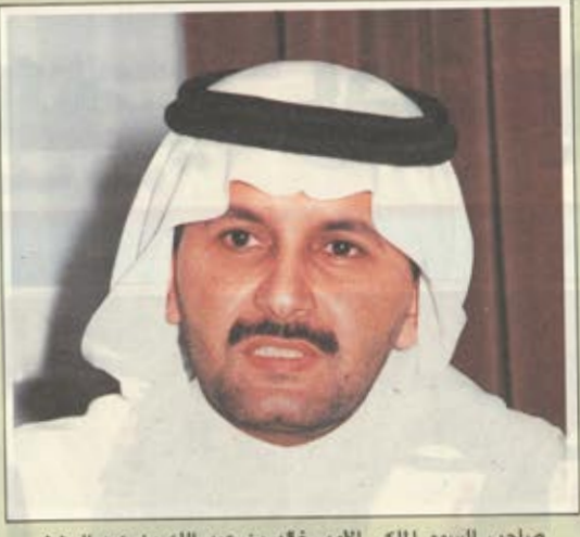
صلحب السمو الملكي الأمير خالد بن عبد الله بن عبد العزين