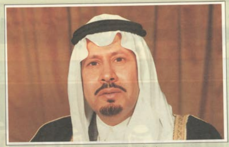
صاحب السمو الملكي الأمير بدر بن عبد العزيز