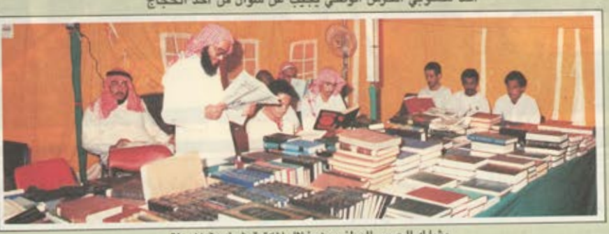
يشارك الحرس الوطني من خلال المكتبة في خدمة المعرفة