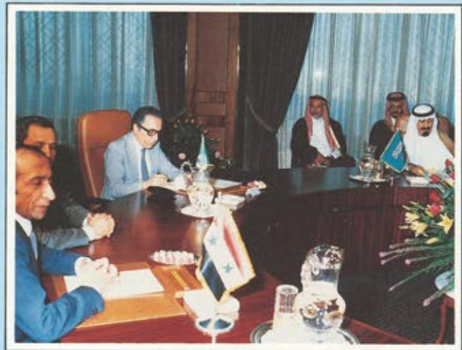
سمو الأمير عبد الله ... واجتماع لتقنية الاجواء العربية

ولاشك ان هذه الخطوة . التي قامت بها المملكة في سبيل تحسين العلاقات العربية ووحدة الصف العربي . هذه الخطوة هي مما يحرص عليه المسؤولون في المملكة وعلى رأسهم جلالة الملك المفدى فهد بن عبد العزيز وسمو ولي العهد الامير عبد الله بن عبد العزيز ولى العهد ونائب رئيس مجلس الوزراء ورئيس الحرس الوطني .