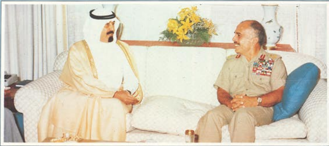
سمو الأمير عبد الله مع جلالة الملك حسين