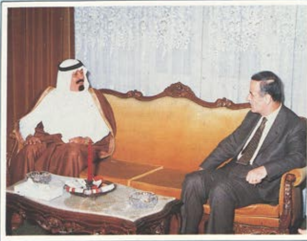
سمو الامير عبد الله مع فخامة الرئيس حافظ الاسد