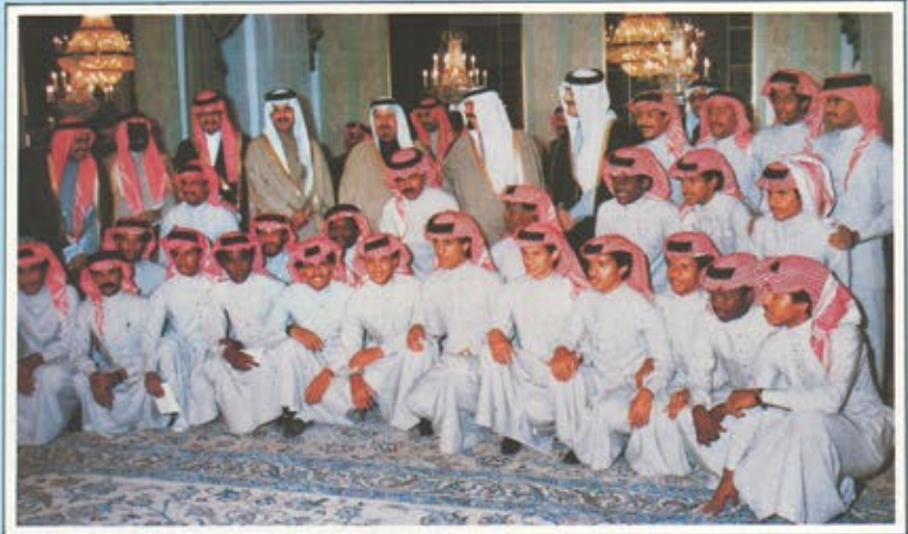
المنتخب السعودى للناشئين بطل اسيا

افتتحه صاحب السمو الملكى الامير سظام بن عبد العزيز نائب امير منطقة الرياض في مدينة شتوتجارت ، والثاني افتتحه الاستاذ عبد الله النعيم امين مدينة الرياض في مدينة هامبورج .