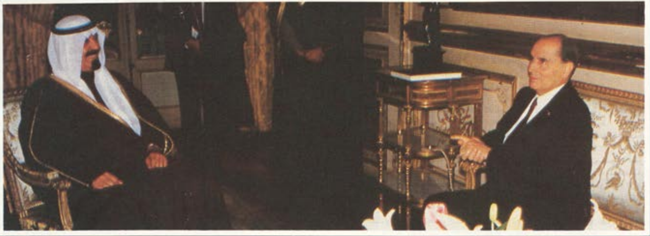
سمو الامير عبد الله ولقاء مع الرئيس الفرنسي ميتران ..