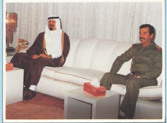
سمو الامير عبد الله ولقاء مع فخامة الرئيس صدام حسين

★ شهدت الساحة الدولية في شهر يناير كانون الاول - تحركا سياسيا مكثفا من اجل صالح القضايا العربية والاسلامية . فكانت زيارة صاحب السمو الملكي الامير عبد الله بن عبد العزيز ولي العهد . ونائب رئيس مجلس الوزراء ورئيس الحرس الوطني الى كل من الجزائر ، وفرنسا ، وسوريا . ★ وفي شهر اغسطس ١٩٨٥ م . كانت القمه العربية الطارئة في الرباط بدعوة من الملك الحسن الثاني عاهل المغرب . وحضر القمه نيابة عن جلالة الملك فهد . ولي عهده صاحب السمو الملكي الامير عبد الله بن عبد العزيز . القمة الاردنية السورية في دمشق .. ثمرة الجهود السعودية لتنقية الاجواء العربية . ● بعد قمة الرباط الطارئة التي عقدت في ٨ . ٧ اغسطس ١٩٨٥ م .. تم الاتفاق عن قناعة بان تنقية الاجواء العربية هي الارضية التي يجب ان تعالج اولاً .. لان وحدة الصف