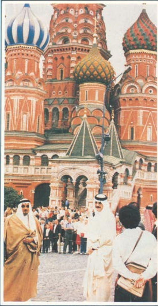
سمو الأمير فيصل بن فهد في موسكو

الفضائي ديسكفري ٥١ - جي كأول رائد فضاء عربي مسلم . ولقد تابع جلالة الملك فهد بن عبدالعزيز تلك الرحلة من العاصمة المقدسة مكة المكرمة . وجرى اتصالا هاتفيا مع سمو الامير سلطان اثناء وجوده في المريخية . * اما الثاني فكان اطلاق القمر الصناعي العربي الثاني . عرابسات . من أجل تحقيق الاتصالات والروابط الثقافية والاعلامية بين شعوب الامة العربية والإسلامية .