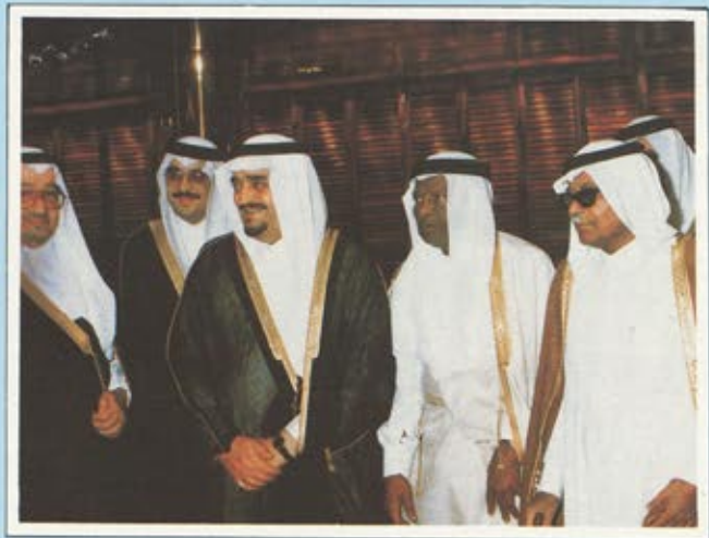
جلالة الملك فهد مع الفائزين بجائزة الملك فيصل