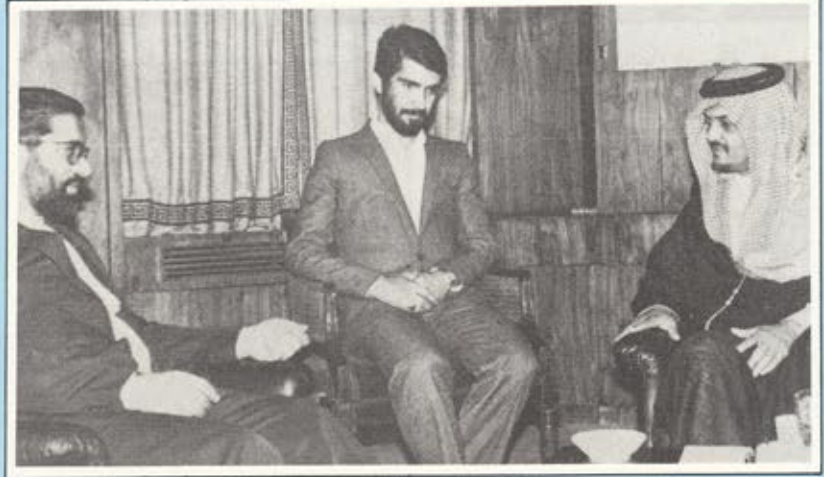
زيارة الامير سعود الفيصل لايران .. مساع لانهاء الحرب

★ في ٣١ يوليو افتتحت في الصين الشعبية بطولة كاس العالم الاولى للناشئين وهي البطولة التي شارك فيها منتخب الناشئين السعودى وابلى بلاء حسنا شد اليه الانظار