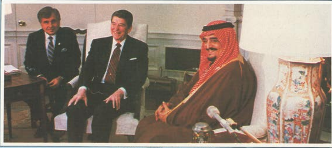
اول قمة سعودية امريكية منذ اربعة عشر عاما