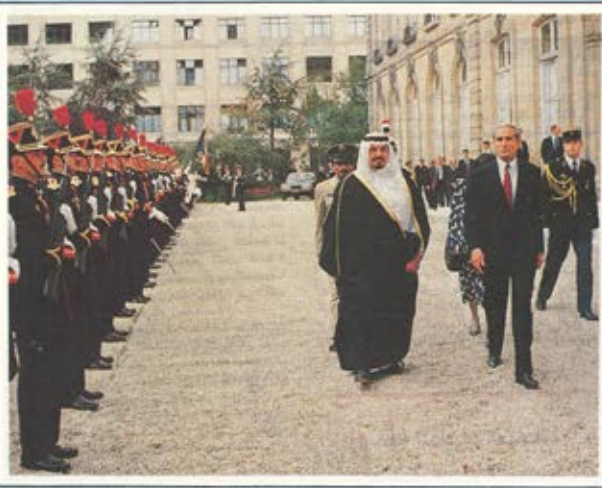
استقبال رسمي فرنسي لسمو الامير سلطان بن عبد العزيز