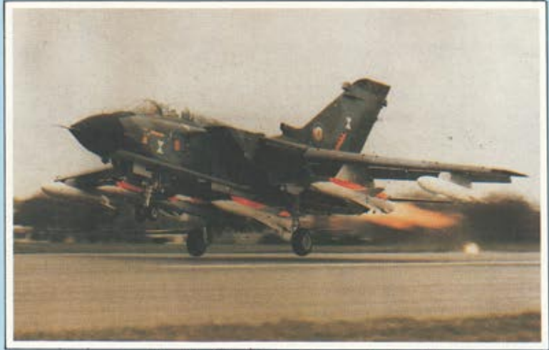
الطائرة « التورنادو » . . قوة جديدة تضاف للمقدرة الجوية السعودية

اجمع حينما اصبح لديها فائض من انتاج القمح ضاربة بذلك مثلا يحتذى لقدرة الانسان العربي على صنع المعجزات . * كما وقعت المملكة في شهر ديسمبر مع دولة البحرين الشقيقة اتفاقية المؤسسة العاصمة لجسر السعودية البحرين الذي سيفتح خلال الشهور الاولى من عام ١٩٨٦م وهذا الجسر الحيوى الذى يعتبر احدى معجزات العصر سوف يربط البحرين الشقيقة لأول مرة باليابسة . وسوف يدعم الروابط بين المملكة ودولة البحرين . بالاضافة الى انه سيعمل على خفض التكلفة المروية . وسيحدث هذا الجسر تغييرا في جغرافية المنطقة