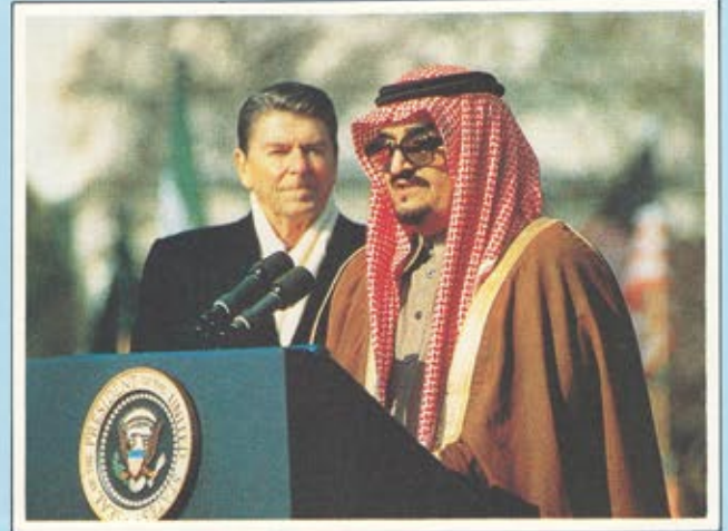
جلالة الملك فهد يتحدث في امريكا عن حقوق العربية