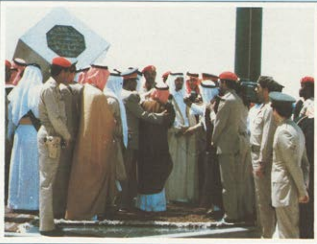
جلالة الملك فهد في افتتاح مدينة الملك خالد العسكرية