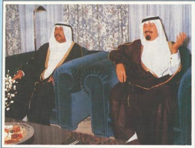
لقاء بين سمو الامير عبد الله بن عبد العزيز وولي عهد الكويت في قصر البستان بمسقط