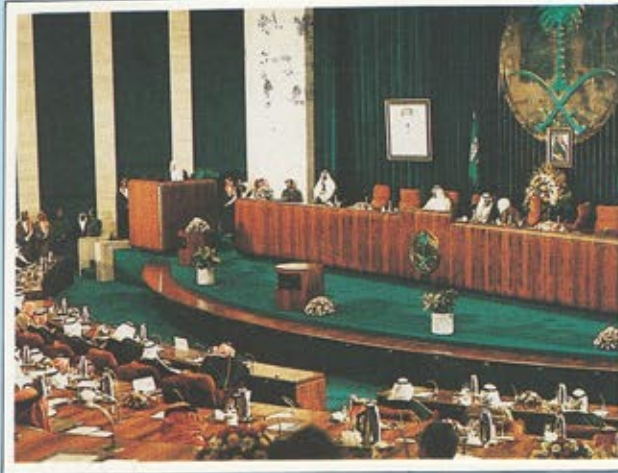
الجلسة الافتتاحية للمؤتمر العالمي لتاريخ الملك عبد العزيز