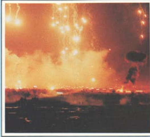
« العرين » اكبر مناورة بحريها الحرس الوطني

اضحت المملكة في عام ١٩٨٥ كسابق عهدها منبرا ثقافيا تتطلع اليه الشعوب العربية والإسلامية والعالمية : * ففي شهر ابريل قام صاحب الجلالة الملك فهد بن عبد العزيز المغدى بافتتاح المهرجان الاول للتراث والثقافة . الذي اقيم تحت رعاية صاحب السمو الملكي الامير عبد الله بن عبد العزيز ولى العهد ونائب رئيس مجلس الوزراء ورئيس الحرس الوطني . وقد اعطى هذا