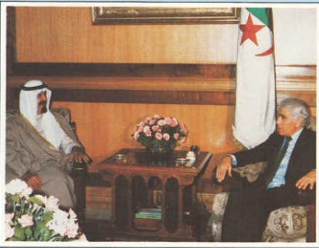
سمو الأمير عبد الله ولقاء مع الرئيس الجزائري الشاذلي بن جديد