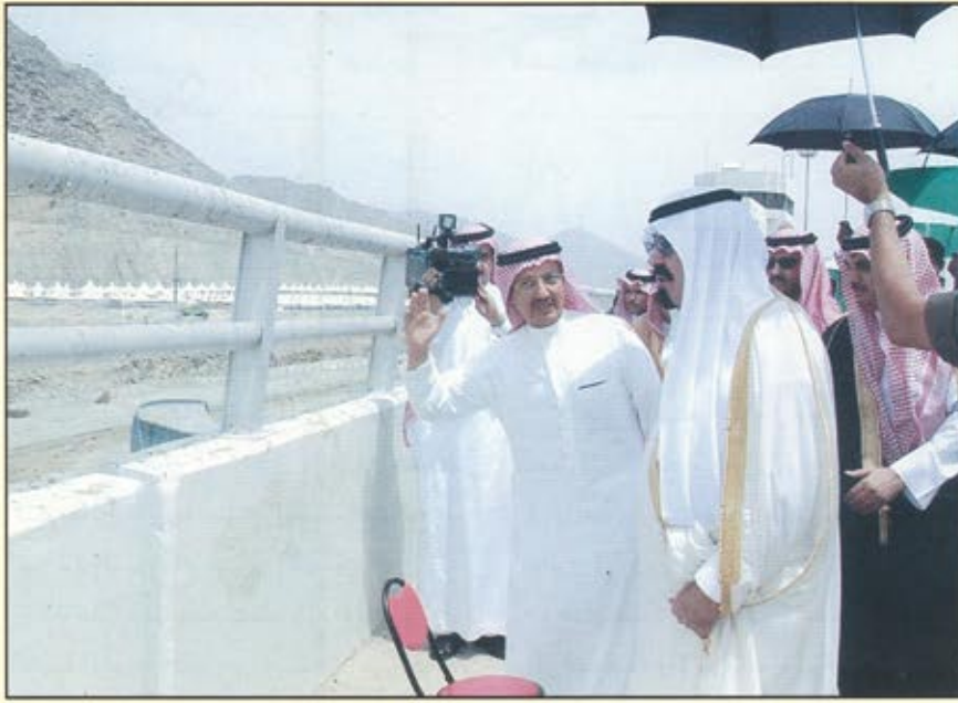
خادم الحرمين الشريفين والوقوف على مشروعات التوسعة في المشاعر

السعوديين في الدولة من مدنيين وعسكريين وكذلك المتقاعدين بنسبة ١٥ بالمئة ، باستثناء الوزراء ومن في مرتبتهم وشاغلي المرتبة الممتازة.