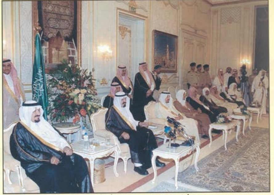
خادم الحرمين الشريفين يستقبل أبناء المدينة المنورة، ويعلن تخصيص أربعة مليارات ريال لمشروعات المسجد النبوي

ثلاثة عشر ألف مليون ريال ليصبح رأسماله ٠٠٠ ر ٠٠٠ ر ٠٠٠ ر ٢٠ عشرين ألف مليون ريال وذلك لدعم القطاع الصناعي وتحفيز المزيد من الاستثمارات الصناعية من داخل المملكة وخارجها .