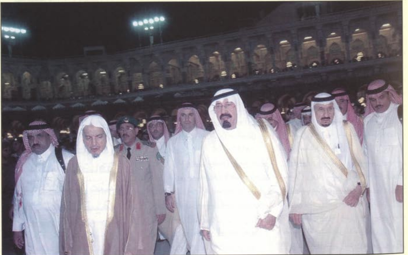
مسيرة مباركة بدأت بالطواف حول البهت العتيق

- زيادة رواتب العاملين في الدولة (مدنيين وعسكريين) بنسبة ١٥٪ وهذه الزيادة الأولى منذ (٢٥) عاماً.