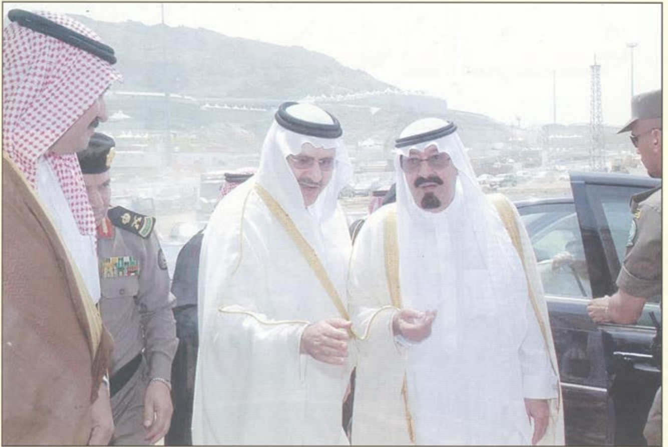
خادم الحرمين الشريفين يتفقد أعمال التوسعة في المشاعر المقدسة

كل ذلك في العفو الكريم عن بعض المساجين، واتباعه كل ذلك بزيادة الرواتب ومخصصات التقاعد.