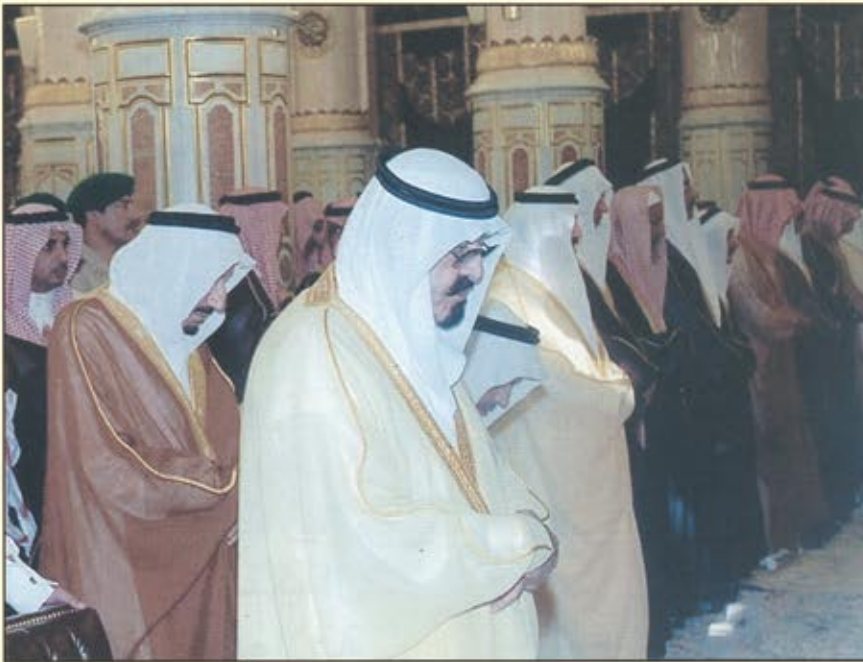
والصلاة في المسجد النبوي

الخدمات المقدمة للمواطن... كل هذه القرارات السامية تلقاها المواطن والمقيم والمتابع للشأن الداخلي بارتياح عارم ودعوات متواصلة أن يبارك في هذا العهد الجديد كما أنعم الله علينا في العهد السابق والحمد لله..