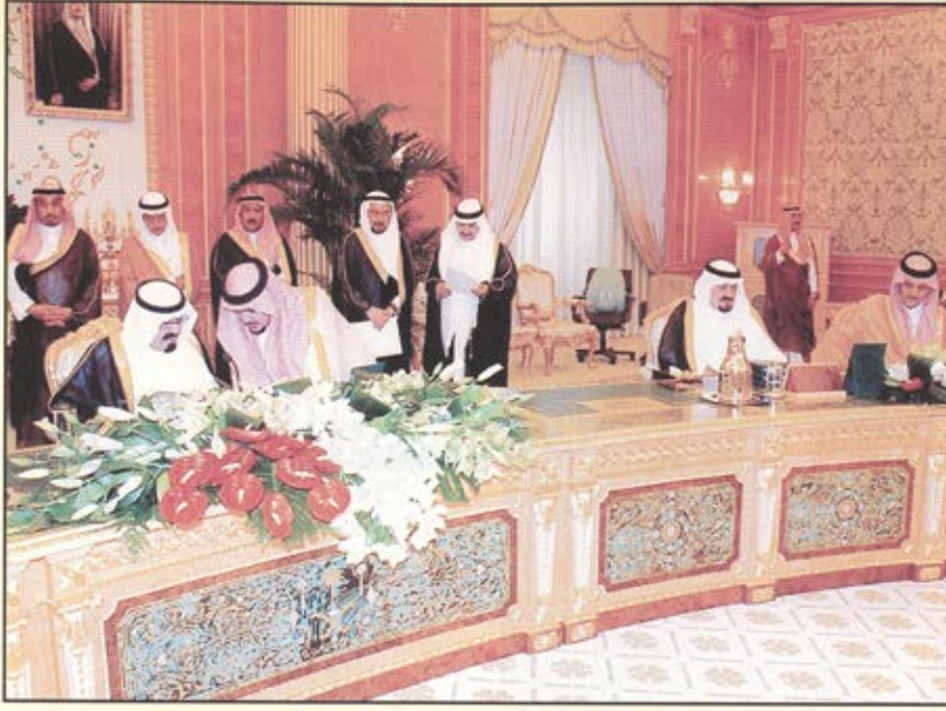
الملك عبدالله يترأس أول جلسة لمجلس الوزراء بعد البيعة