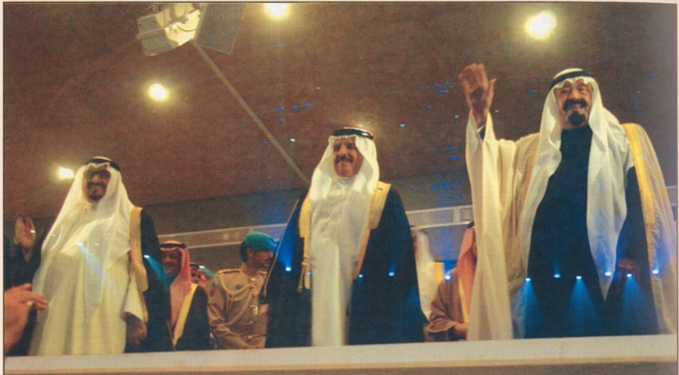
خادم الحرمين الشريفين في الحفل الافتتاحي للجنادرية ٢٣ وعلى يمينه جلالة ملك البحرين الشقيقة وسمو ولي العهد