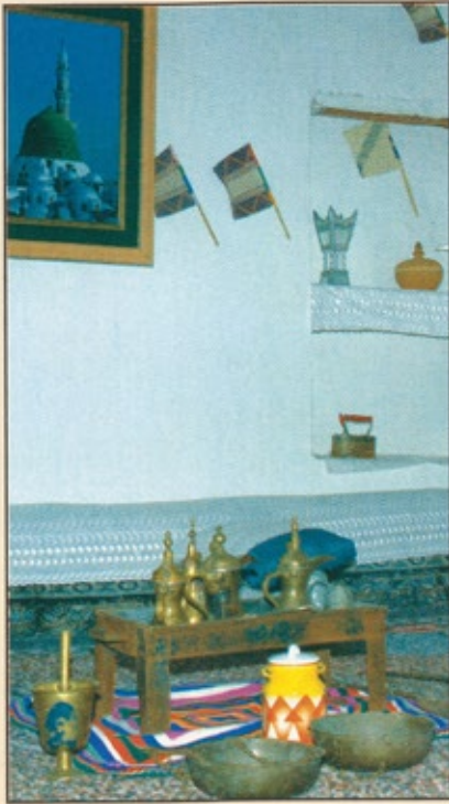
معروضات تراثية في أحد أجنحة المناطق