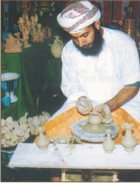
تشارك بعض دول مجلس التعاون الخليجي في المهرجان في كل عام