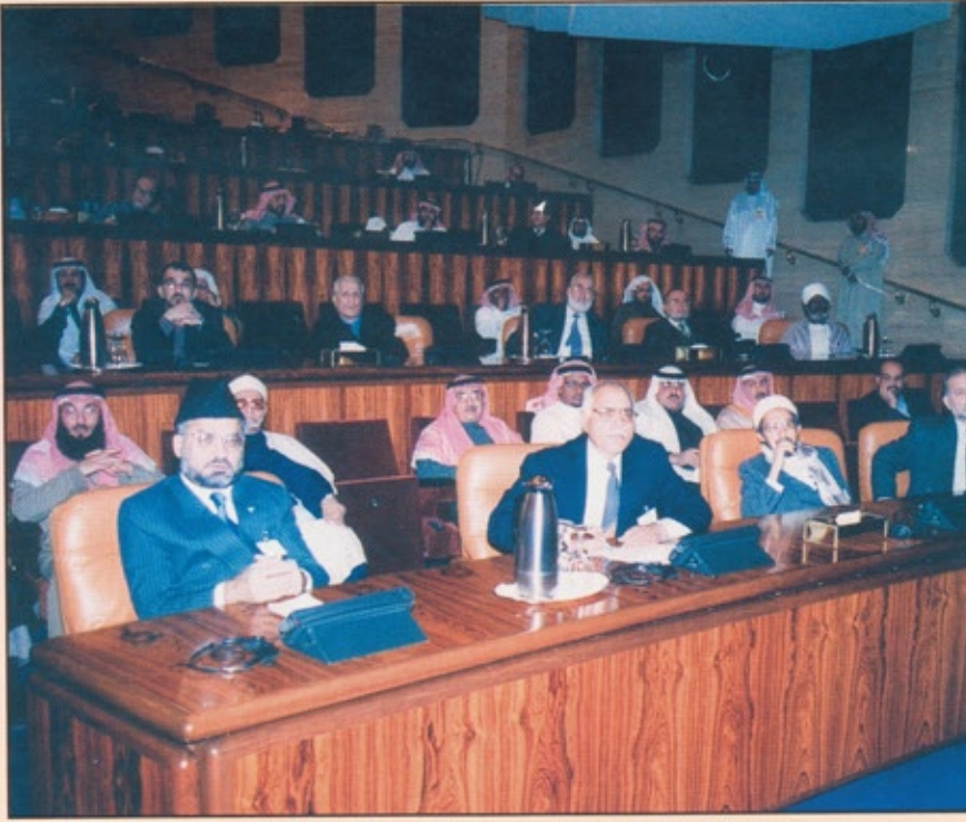
جانب من الحضور لاجدى الندوات الثقافية