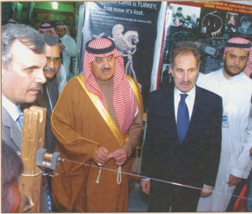
سمو الأمير متعب بن عبدالله يفتتح جناح تركيا في الجنادرية