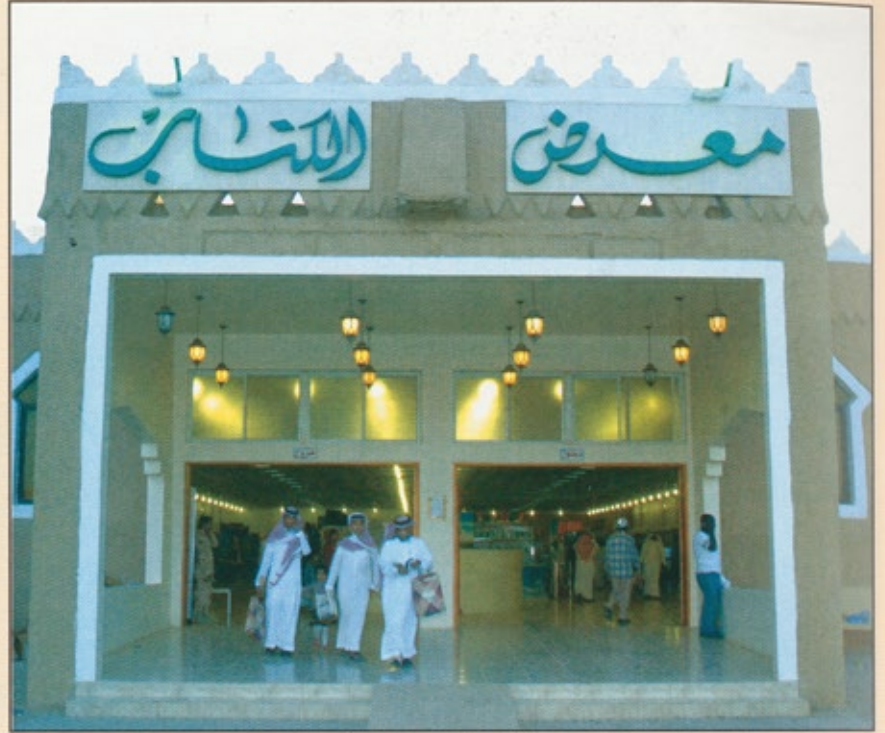
مدخل معرض الكتاب الذي يقام سنوياً في الجنادرية