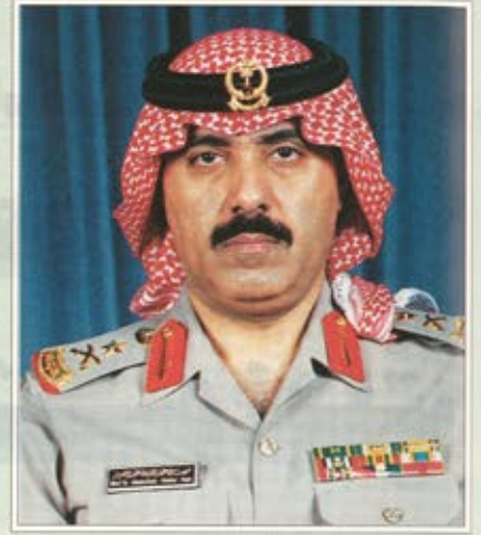
الفريق ركن متعب بن عبدالله:

أجيال الملك عبدالعزيز قادة بإذن الله على أن تكون القوة المهابة القادرة على حماية مكتسبات كيان عبدالعزيز ورجاله الأفاضل.