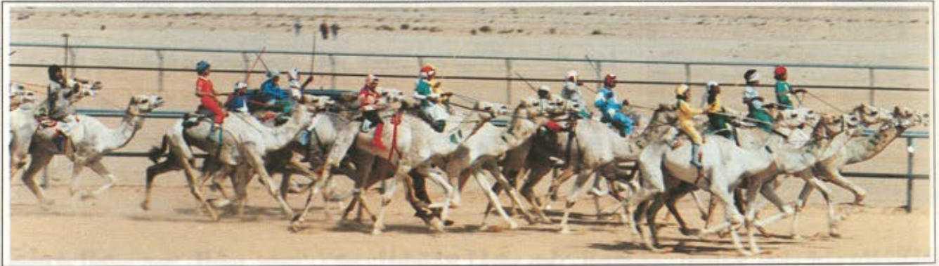
نقطة من سباق الهجن الكبير

المحايدون كالجبرتي في تاريخه ، واحمد البديري في حوادث دمشق اليومية ، ما يتعرض له حجاج بيت الله الحرام من قتل ونهب وسلب . والشاهد على ذلك ما جاء في قصيدة أمير الشعراء شوقي ( في الجزء الثاني من ديوانه ) :