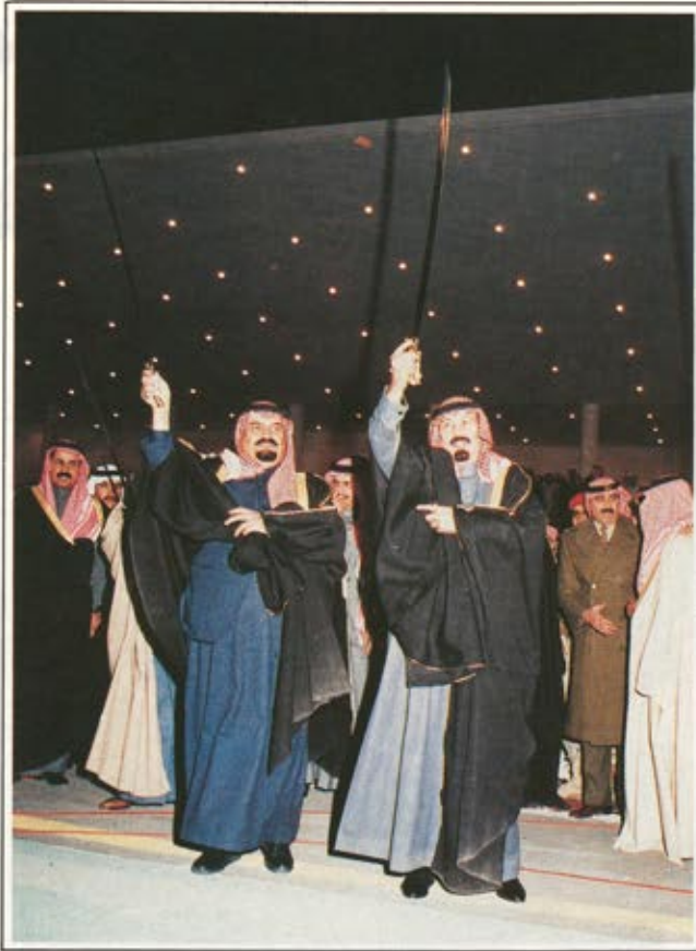
صاحب السمو الملكي الامير عبدالله بن عبد العزيز يؤدي العرضة السعودية

● سيكون لعهدكم الميمون - ياخادم الحرمين - مكان مميز في التاريخ .. فلم يسجل التاريخ من هذه البلاد تأمرا على شعب شقيق ، ولا انحرافا مع الهوى، ولا دفعاً بقوة ظالمة خارج الحدود .