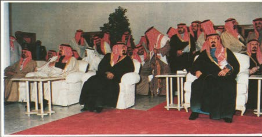
سمو الامير عبدالله بن عبدالعزيز يتابع الحفل الخطابي والفني الذي اقيم بالجنادرية