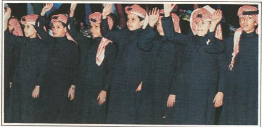
ابناء شهدائنا.. شهدوا فعاليات المهرجان في يومه الاول