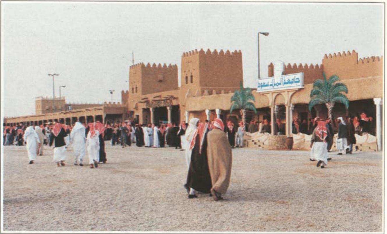
السوق الشعبي الذي اقيم بالجنادرية