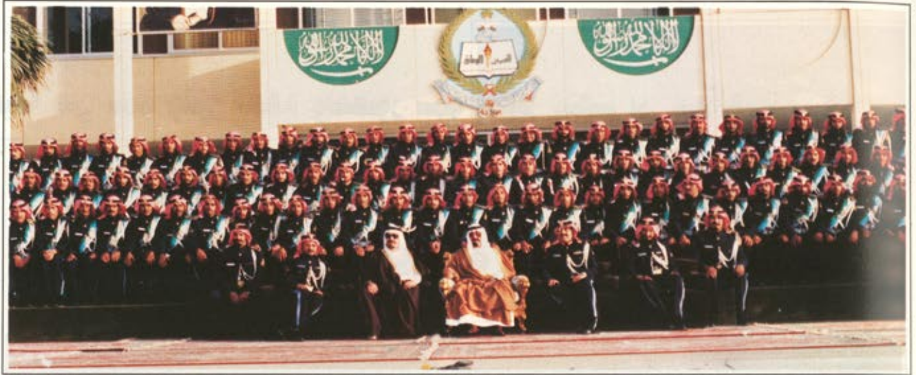
صاحب السمو الملكي الامير عبدالله بن عبدالعزيز وصاحب السمو الملكي الامير بدر بن عبدالعزيز في لقطة تذكارية مع خريجي الدفعتين بعد انتهاء مراسم حفل التخرج

العسكرية ، بحيث يستطيع المتخرج ان يعمل في وحدات الحرس الوطني المتطورة وهو مزود بكل ما يلزم لهذا العمل فضلا عن امكانية التعامل مع المستقبل بثقة وقدره . فالمتخرج من كلية الملك خالد العسكرية يحمل زادا ثريا من الخبرات والمعارف تتوجه القيم الاسلامية النبيلة التي تجعله انسانا صالحا في مختلف المواقف والظروف .