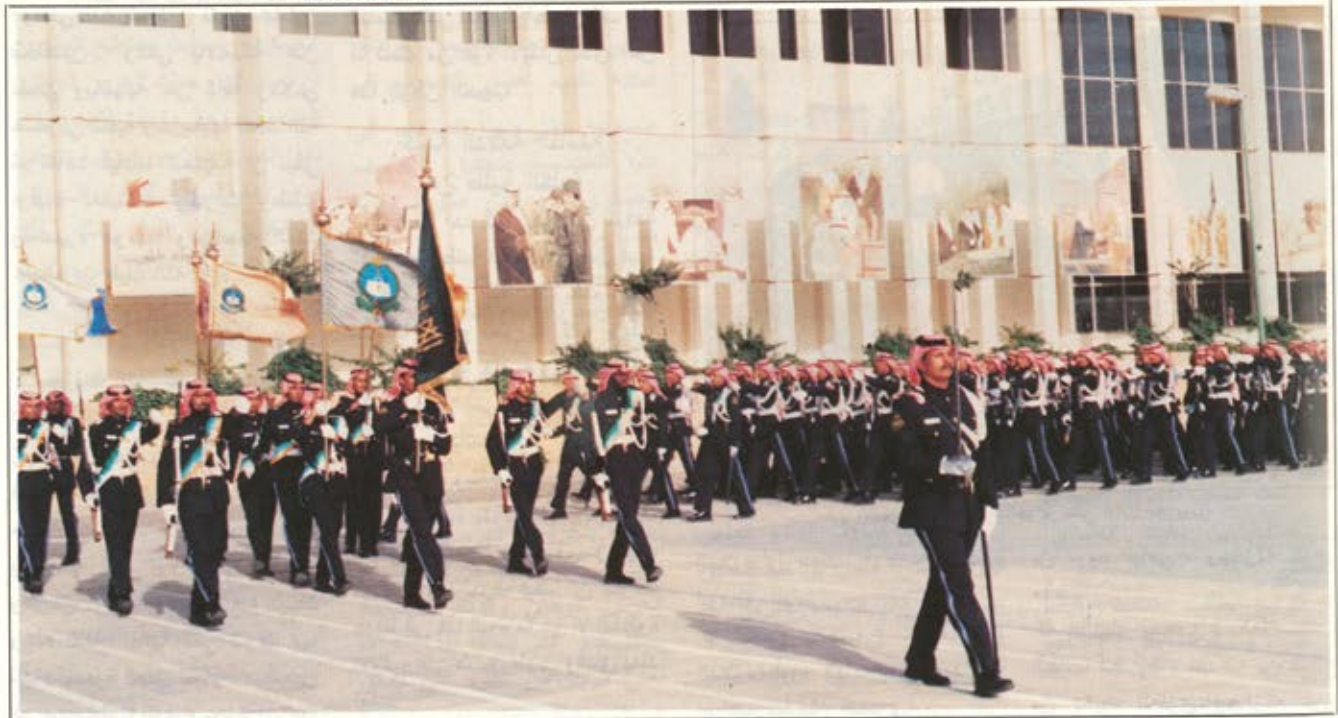
طابور استعراض الكلية يتقدمه حملة الاعلام

وهي مسؤولية الامانة. اخواني : لقد اعطتكم بلادكم كل ما تستطيعه والآن جاء دوركم وانتم اهل للعطاء ثم انني اوصيكم ونفسي بتقوى الله أولا وقيل كل شيء ، وان تضعوا دائما نصب اعينكم اهتمامكم المتواصل في الاطلاع والتحصيل لتستطيعوا بلورة ما قد درستموه وتدرّبتم عليه في هذه الكلية الى برامج عملية وتدريبية