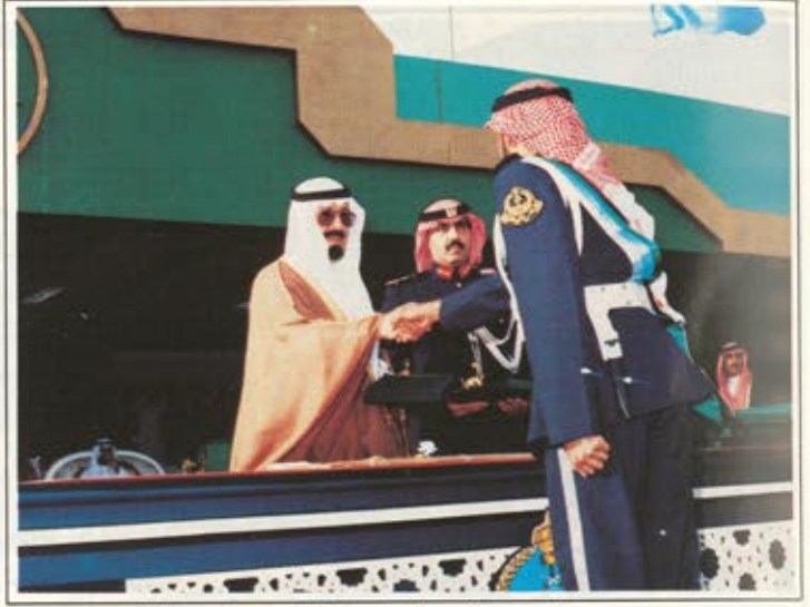
سمو الامير عبدالله بصافح احد المتفوقين من خريجي الكلية