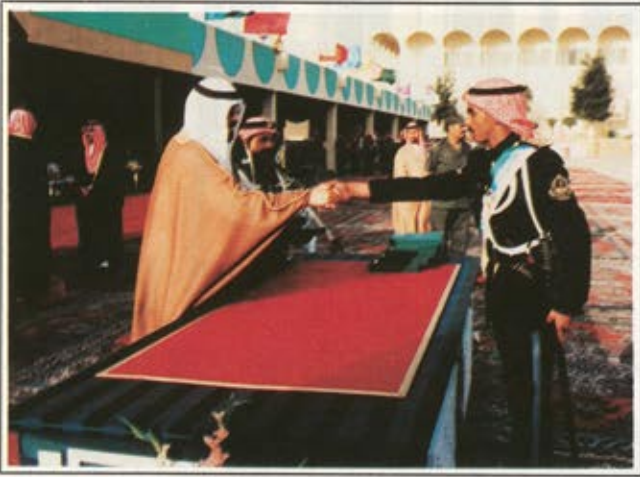
سمو الامير عبدالله يوزع الجوائز على اوائل الخريجين