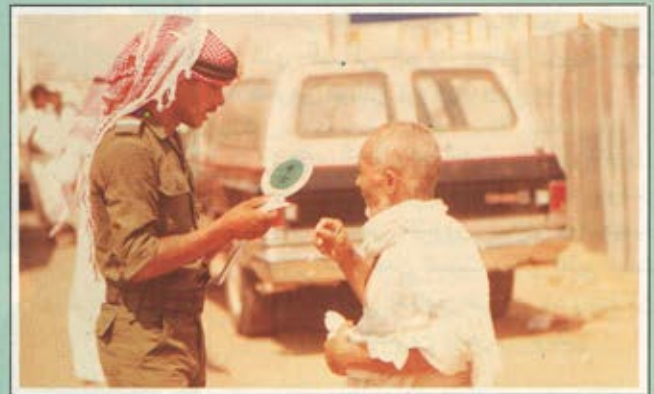
مياه مثلجة يقدمها أحد رجال الحرس الوطني لواحد من الحجاج