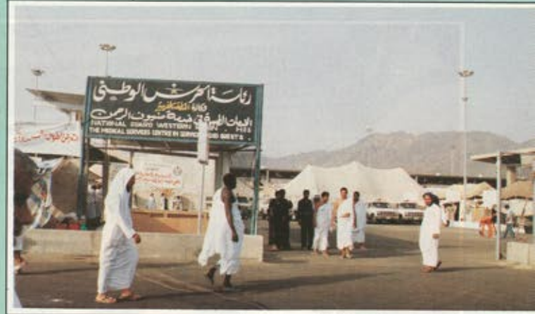
أحد المراكز الطبية التابعة للحرس الوطني في منى