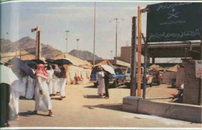
المركز الثقافي والاعلامي للحرس الوطني في منى