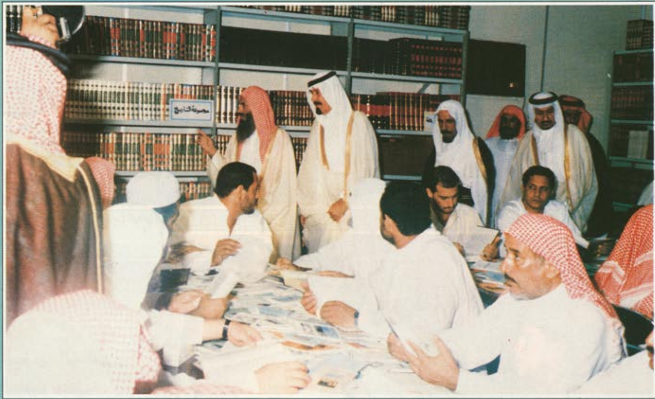
وسموه يتفقد المكتبة العامة في منى التي تحتوي على العديد من أمهات الكتب الدينية

وتعاون بين هذه المراكز الطبية وأجهزة وزارة الصحة وجمعية الهلال الأحمر السعودي .