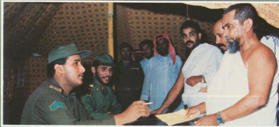
عدد من الحجاج أثناء مراجعة أحد المراكز الطبية في عرفات