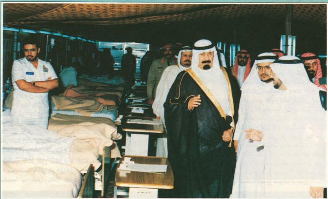
سمو الأمير عبدالله بن عبدالعزيز أثناء تفقده لأحد المراكز الطبية التي أقامها الحرس الوطني في المشاعر المقدسة