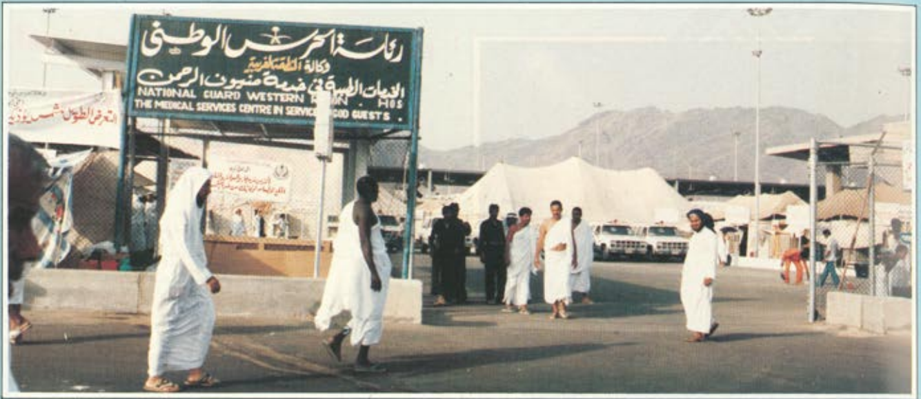
الخدمات الطبية للحرس الوطني. تتواجد في جميع مناطق المشاعر المقدسة لخدمة ضيوف الرحمن