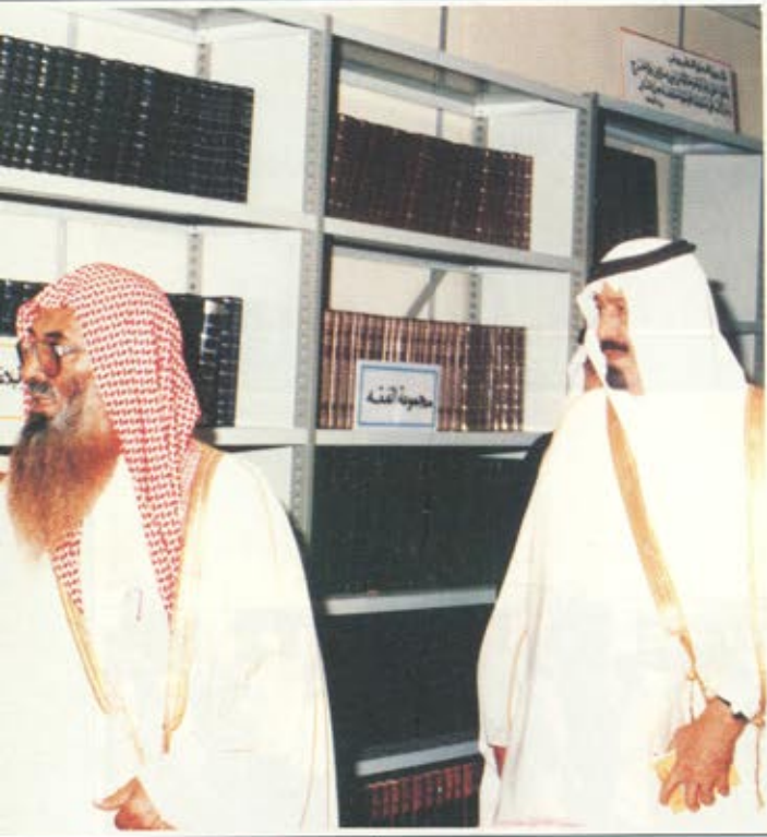
.. ويتفقد سموه المكتبة العامة في منى التي يقيمها الحرس الوطني سنويا