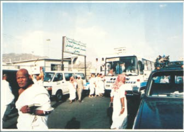
معسكر الحرس الوطني بمنى الذي تقيمه وكالة الحرس الوطني بالمنطقة الغربية