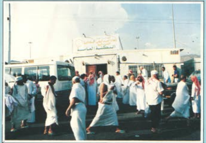
المكتبة العامة للحرس الوطني بمنى تزخر بامهات الكتب الدينية