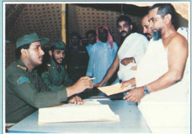
مجموعة من ضيوف الرحمن اثناء مراجعتهم لأحد المركز الطبية بمنى

ومهمتها مكملة لاعمال الادارة الهندسية . وقال ان ادارة الامدادات والتموين تقوم بمهمة تزويد مقرات الحرس الوطني ووحداته ومرافقه بجميع ما تحتاجه من تموين وامداد ومتطلبات عينية مختلفة . واضاف ان الشرطة العسكرية تعد وحدة متكاملة تقوم بحراسة المقرات وتنظيم حركتها ويشارك افرادها بارشاد الحجاج التائهين الى مساكنهم ومخيماتهم كما يشارك بعض افرادها في تنظيم السير بالتنسيق مع ادارات المرور المعنية والى جانب ذلك فان هناك في المشاعر المقدسة وحدات أمنية مساندة للحرس الوطني ولها دورها المهم في الحفاظ على الأمن والأمان لراحة وطمانينة ضيوف الرحمن .