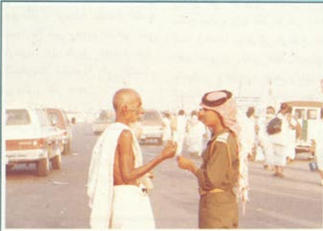
أحد رجال الحرس الوطني يرشد حاجا في المشاعر المقدسة