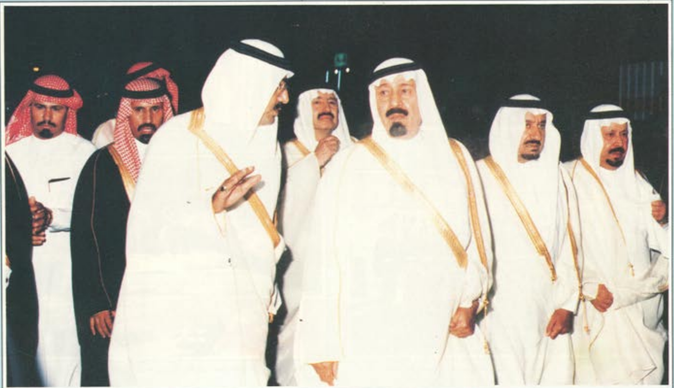
صاحب السمو الملكي الأمير عبدالله بن عبدالعزيز يتفقد مواقع الحرس الوطني في المشاعر المقدسة العام الماضي

الواجب المقدس جنباً الى جنب مع الاجهزة الحكومية الاخرى حيث كثفت استعداداتها ووضعت امكاناتها لهذا الغرض وأخذت اجهزة الوكالة المختلفة مكانها بالمشاعر المقدسة في المجال الامني والطبي والديني والثقافي والاعلامي بالتنسيق مع الاجهزة الحكومية المعنية المشاركة في اعمال الحج.