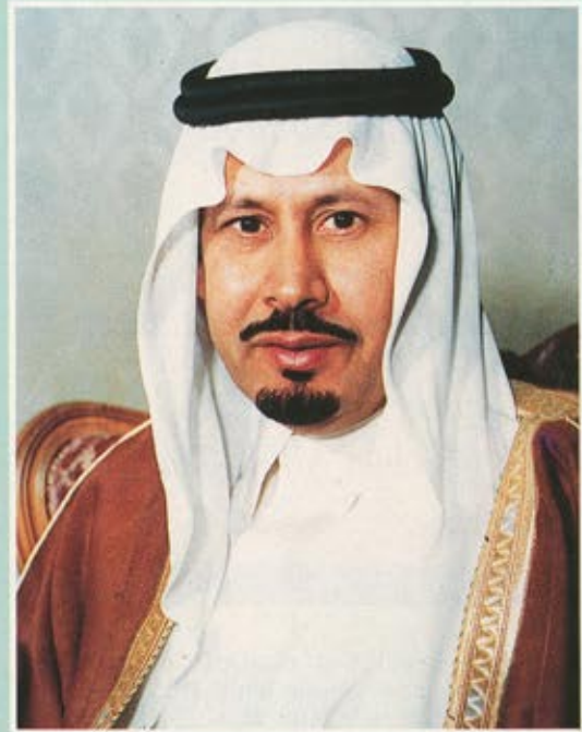
سمو الأمير بدر بن عبدالعزيز رئيس هيئة الاشراف

مجلة الحرس الوطني . ويأتي ذلك في اطار الخطوات التطويرية لمجلة الحرس الوطني من أجل دعم مسيرتها للاضطلاع برسالتها العسكرية والثقافية والإبداعية في المملكة وفي العالم العربي . وصرح معالي وكيل الحرس الوطني الاستاذ عبدالرحمن ابو حيمد بأن المجلة ، التي صدرت منذ سنة عشر عاماً ، تلقي كل الاهتمام والرعاية والدعم من سمو ولي العهد . حفظه الله . ومن سمو الأمير بدر بن عبدالعزيز رئيس هيئة الاشراف على المجلة .. لتكون هدية الحرس الوطني للحركة الثقافية والإبداعية في الوطن العربي ، وسوف تعمل هيئة الاشراف في المجلة ، وهي الهيئة المناط بها رسم استراتيجية المجلة وآفاق عطاها ، سوف تعمل على خلق كل الفرص لتؤذي رسالتها على أرقى