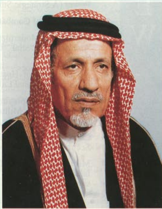
معالي الشيخ عبدالعزيز التويجري نائب رئيس هيئة الاشراف