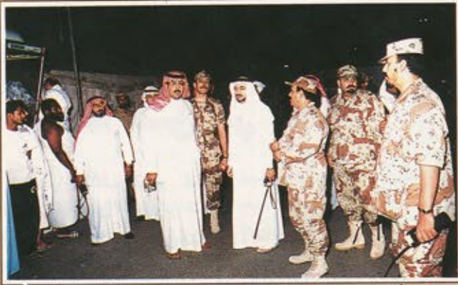
سمو الأمير فيصل بن عبدالله يتلقى جهود الحرس الوطني لخدمة ضيوف الرحمن