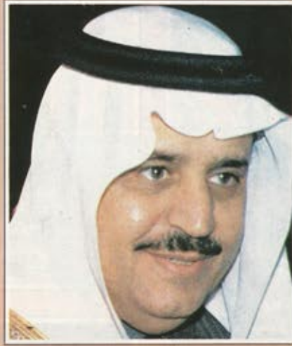
سمو الامير نايف بن عبدالعزيز