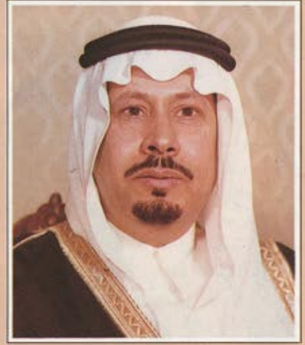
سمو الامير بدر بن عبدالعزيز