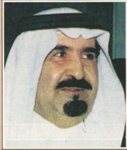
سمو الامير ماجد بن عبدالعزيز