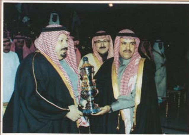
سمو الأمير بدر أثناء تسليم كأس خادم الحرمين الشريفين لسمو الأمير طلال بن بدر. كان لها أكبر الأثر في نجاحه المستمر . الدكتور علي بن محمد النجعي . الاستاذ راشد بن عبدالمحسن بنن الله .