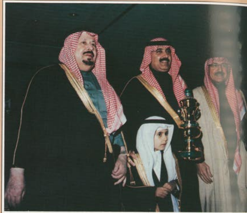
سمو الأمير بدر لدى تسليم كأس خادم الحرمين الشريفين لخبيل الانتاج المحلي الى سمو الأمير متعب بن عبدالله.