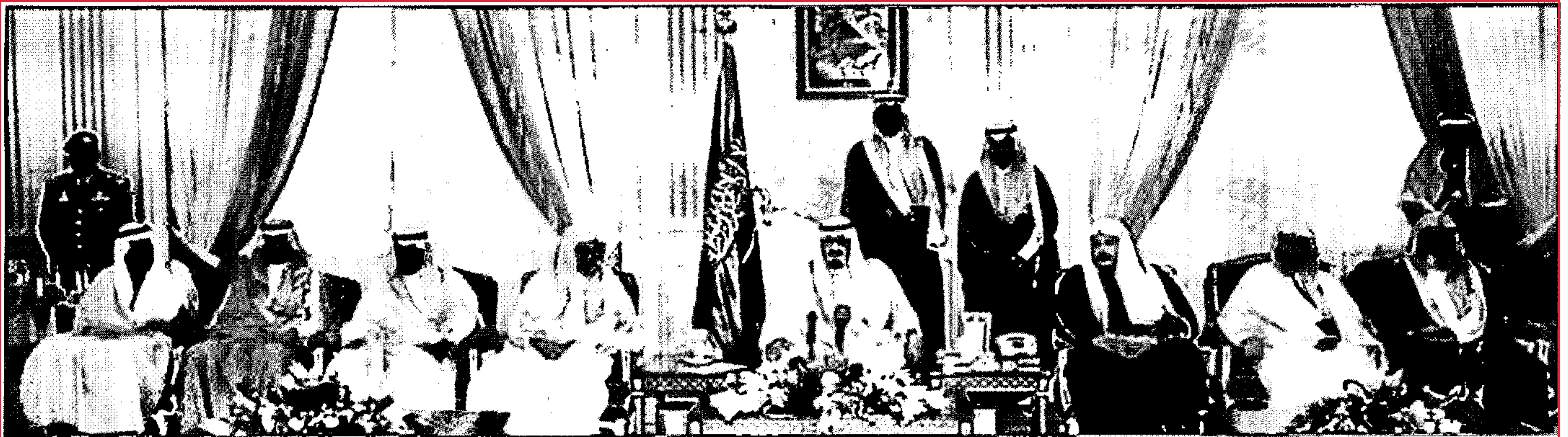
رئيس وأعضاء مجلس الشورى يؤذون القسم بين يديه