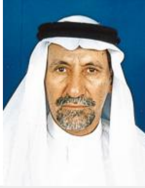
سعيد بن محمد الروبيخ*

لقد كسبت الرهان بأن عهد خادم الحرمين الشريفين الملك عبدالله - حفظه الله - سيكون عهد انطلاقاً موفقة نحو الازدهار والرقى باذن الله، لقد استشعرت ذلك من خلال معرفتي لهذا الرجل الشهم الودود وما تمتاز به شخصيته من مقومات فذة لرجل سياسي في التعامل مع المتغيرات والأحداث فهو يمسك بزمام الأمور كما يمسك بزمام القلوب، فقد سكن قلوب شعبه وملكها لحبه لشعبه وبساطته في التعامل التي تتم عن صدق في المشاعر. ومن الأسباب التي دعنتني لقول ذلك انتقال الحكم اليه بكل سلاسة وهذا ما جعل المراقبين السياسيين والعالم كله ينبهر أمام ولاء هذا الشعب لهذا الرجل.