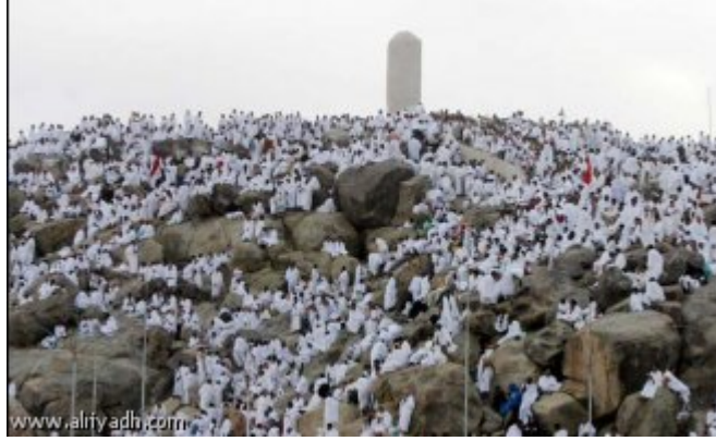
الحجيج على جبل الرحمة في عرفات

جموع الحجيج تستقر بأمان في مشعر منى لذبح الهدي وقضاء أيام التشريق