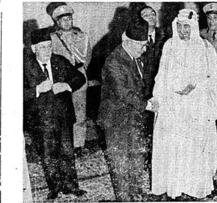
الملك فيصل وجماعته مع الوفد اللبناني المهني لجلالته بارتقائه عرش المملكة

لهذه الرحلة اثرها العميق في نفسه ثم توالى رحلاته السياسية بعد ذلك لتوطيد