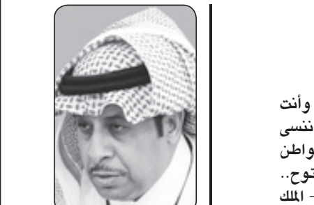
فهد بن عبدالله الغام

■ سيقتفدك إرثك التراثي والثقافي مهرجان الجنادرية الذي انطلق في عام ١٩٨٥م وحقق شهرة واسعة محليا وعربيا وعالميا، وعرضتها السعودية، رقصة السعوديين في السلم والحرب والفرح والتي كتبت فارسها الأول وتؤديها بين إخوانك ومواطنيك. سيفتقدك منتجك المحب خارج مدينة الرياض والتي تقضي فيه بعض الوقت للراحة والاستجمام، ففروضة خريم هذا المنتج البري والذي يتوسطه المخيم الملكي شهد لعائنتك ميزانية الدولة الاستثنائية لعام ٢٠١٥م، وزارها كبار الرؤساء والمسؤولين في العالم لتفردنا بطبيعة خلابة ومميزة. ولعبت معهم أحد هواياتك المتعددة وهي لعبة الكرات الحديدية - البولز - وقد كنت بارعا في إجادتها. ورفي الفاتناتك ولأول مرة في تاريخ العلاقات بين رئيس الكنيسة الكاثوليكية والسعودية، استقبلك البابا بندكتوس السادس عشر في يوم الثلاثاء ٦-١١-٢٠٠٧م خلال جولتك الأوروبية. وبحسب بيان العلاقات تمحورت المباحثات آنذاك حول "الدفاع عن القيم الدينية والأخلاقية والزراع في الشرق الأوسط وأهمية الحوار بين الثقافات والأديان ومساهمة أتباع مختلف الديانات في النهوض بالتفاهم بين البشر والشعوب". وتذكر ماترك على مر الزمن فطوال حياتك العملية وحوك المشايخ والعلماء