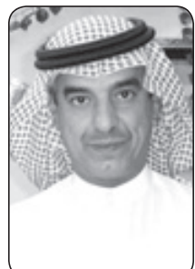
محمد بن عبدالله الحسيني

سعودي يؤدي التحية للسيارة التي حملت الملك رحمه الله بعد وفاته قد أثرت في أكثر من أي شيء آخر، فقد بدا الجندي في وقفته مجسداً لكل الشعب السعودي الذي كان حبل الود بينه وبين قائده رحمه الله أكبر بكثير من حسابات السلطة والمسألة التي تحكم عادة العلاقة بين الحاكم والمحكوم. عزاًوتنا بالطبع في خلفه خادم الحرمين الشريفين الملك سلمان بن عبدالعزيز حفظة الله الذي تربي في بيت القائد الأكبر الملك المؤسس رحمه الله وقاد الرياض طوال خمسين عاما نحو التطور والمدنية، وله باع طويل في السياسة الخارجية، وحضور لافت لدى دول العالم فضلاً عما يمتاز به من ثقافة وإطلاع في كافة المجالات الفكرية والثقافية، ونسال الله أن يعينه ويوفقه ويوفق صاحب السمو الملكي الأمير مقرن بن عبدالعزيز آل سعود ولي العهد نائب رئيس مجلس الوزراء، وصاحب السمو الملكي الأمير محمد بن نايف بن عبدالعزيز آل سعود ولي ولي العهد النائب الثاني لرئيس مجلس الوزراء وزير الداخلية لخير الأمة العربية والإسلامية دائماً وأبداً.