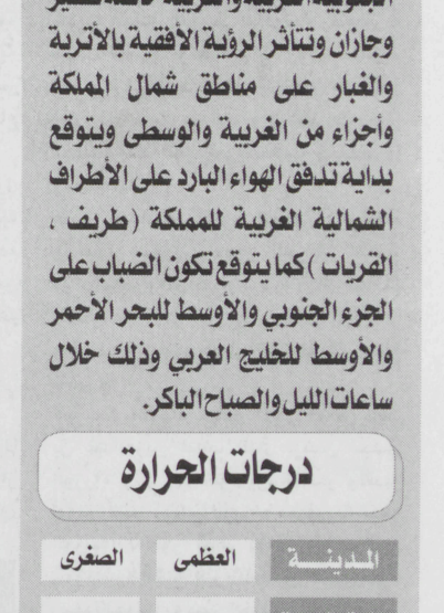
الرياض - واس

مجلس الإدارة وجميع منسوبي النادي بمناسبة حصول النادي على لقب نادي القرن في قارة آسيا. وقال سمو ولي العهد في برقية جوابية لسموه الأمير عبدالرحمن بن مساعد (نشكركم ونقدر لكم وأعضاء مجلس الإدارة وكافة منسوبي النادي هذا الانجاز الطيب ونحمد الله على