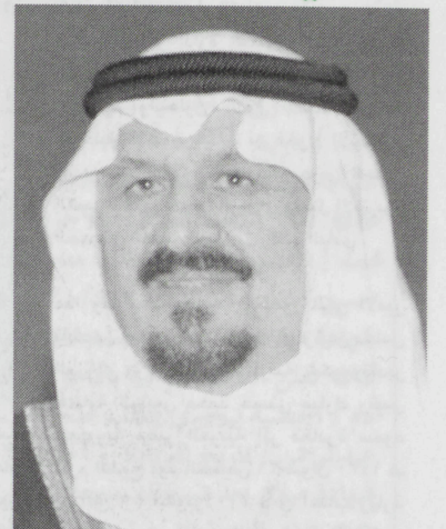
الرياض - واس

مجلس الإدارة وجميع منسوبي النادي بمناسبة حصول النادي على لقب نادي القرن في قارة آسيا. وقال سمو ولي العهد في برقية جوابية لسموه الأمير عبدالرحمن بن مساعد (نشكركم ونقدر لكم وأعضاء مجلس الإدارة وكافة منسوبي النادي هذا الانجاز الطيب ونحمد الله على