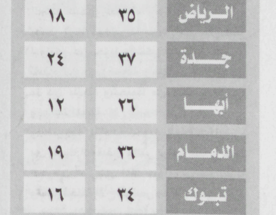
الرياض - واس

مجلس الإدارة وجميع منسوبي النادي بمناسبة حصول النادي على لقب نادي القرن في قارة آسيا. وقال سمو ولي العهد في برقية جوابية لسموه الأمير عبدالرحمن بن مساعد (نشكركم ونقدر لكم وأعضاء مجلس الإدارة وكافة منسوبي النادي هذا الانجاز الطيب ونحمد الله على