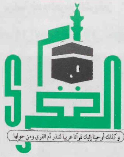
وكذلك أوحينا إليك قرآنًا عربيا لتنذر أم القرى ومن حولها