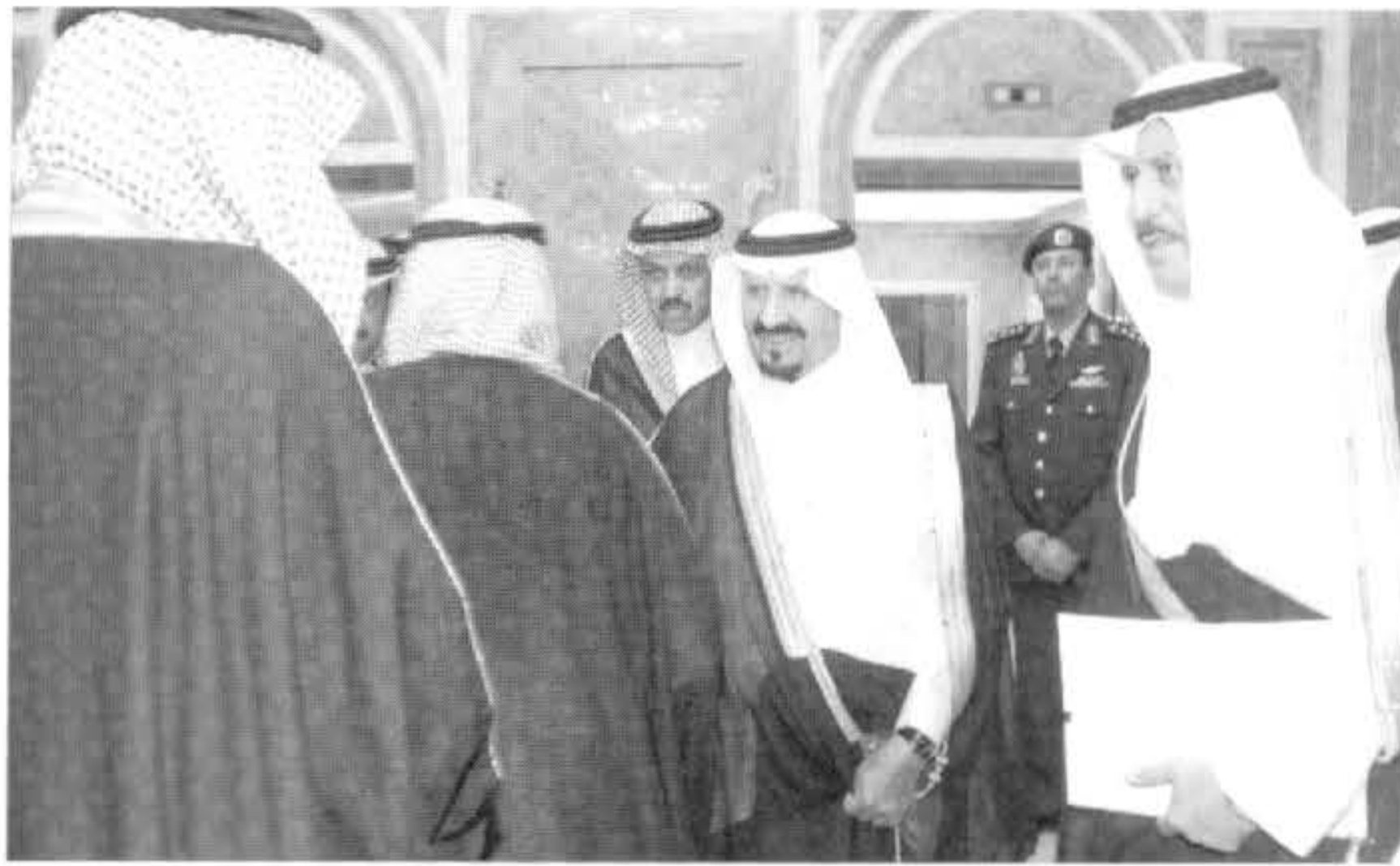
سلطان بن عبدالعزيز آل سعود وولي العهد نائب رئيس مجلس الوزراء وزير الدفاع والطيران والمفتش العام في قصر اليمامة اليوم بنفسه أسرة الجميع يتقدمهم

حضر الاستقبال معالي وزير الدولة عضو مجلس الوزراء الدكتور مساعد بن محمد العيبان ومعالي السكرتير الخاص لسمو ولي العهد الأستاذ محمد بن سالم المري