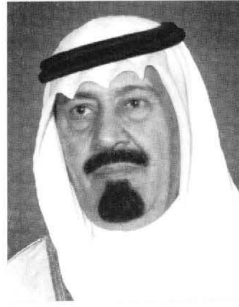
جنته، وأن يعيد المفقودين سالمين وأن يحفظكم وشعب عمان الشقيق من كل سوء، إنا لله وإنا إليه راجعون". كما بعث صاحب السمو الملكي الأمير

صباح الأحمد الجابر الصباح أمير دولة الكويت في وفاة الشيخ نواف بدر سعود المالك الصباح رحمه الله. وقال سمو ولي العهد في برقيته "تلقيت ببلاغ الحزن نبأ وفاة الشيخ نواف بدر سعود المالك الصباح رحمه الله وإنني أبعث لسموكم ولأسرة الفقيد أحر التعازي، وأصدق المواساة، داعياً الله سبحانه وتعالى أن يتغمده بواسع رحمته ورضوانه، ويسكنه فسيح جناته، وأن يحفظكم من كل مكروه، إنا لله وإنا إليه راجعون".