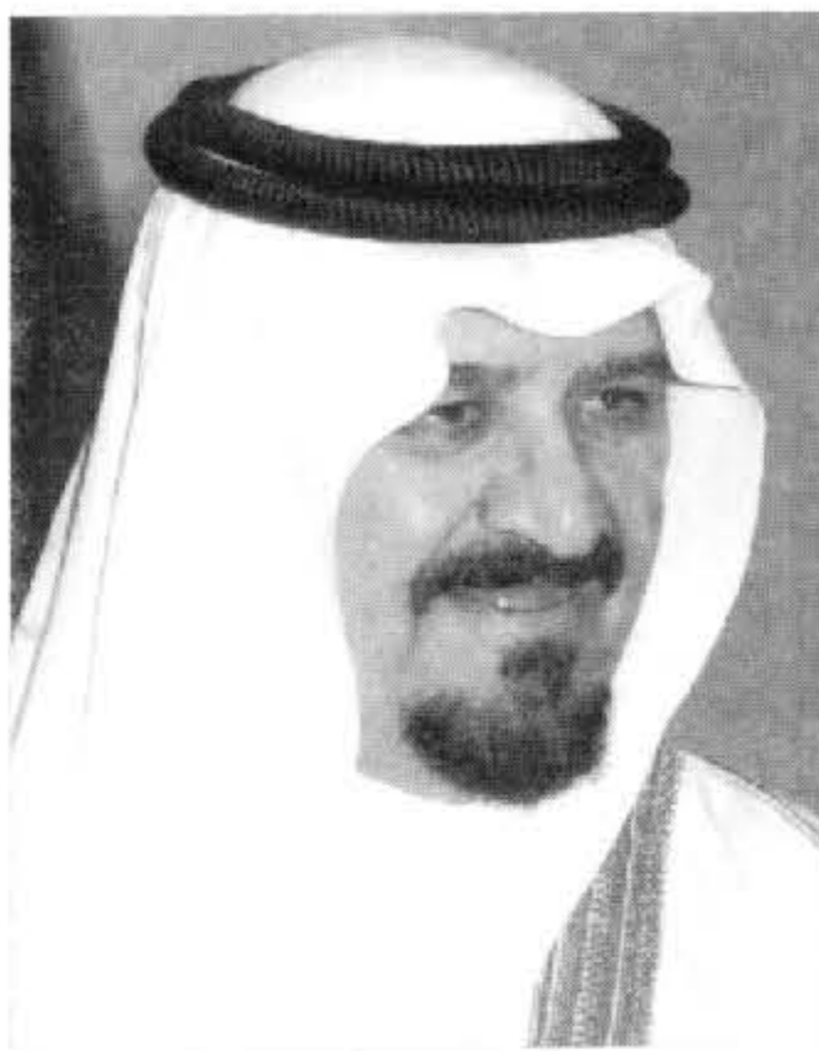
سلطان بن عبد العزيز آل سعود ولي العهد نائب رئيس مجلس الوزراء وزير الدفاع والطيران والمفتش العام برقية عزاء ومواساة لصاحب السمو الشيخ

وقال الملك المفدى في برقيته: "تابعنا بألم بالغ ما نتج عن الإعصار الذي ضرب أنحاء متفرقة من بلدكم الشقيق من وفيات ومفقودين وأضرار، وإننا إذ نبعث لجلالتكم ولأسر الضحايا ولشعب عمان الشقيق باسم شعب وحكومة المملكة العربية السعودية وباسمنا بالغ التعازي، وصادق المواساة، لنسأل الله سبحانه وتعالى أن يتغمد المتوفين بواسع رحمته ومغفرته، ويسكنهم فسيح