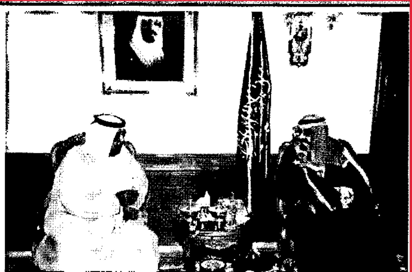
في مقر إقامته في مسقط