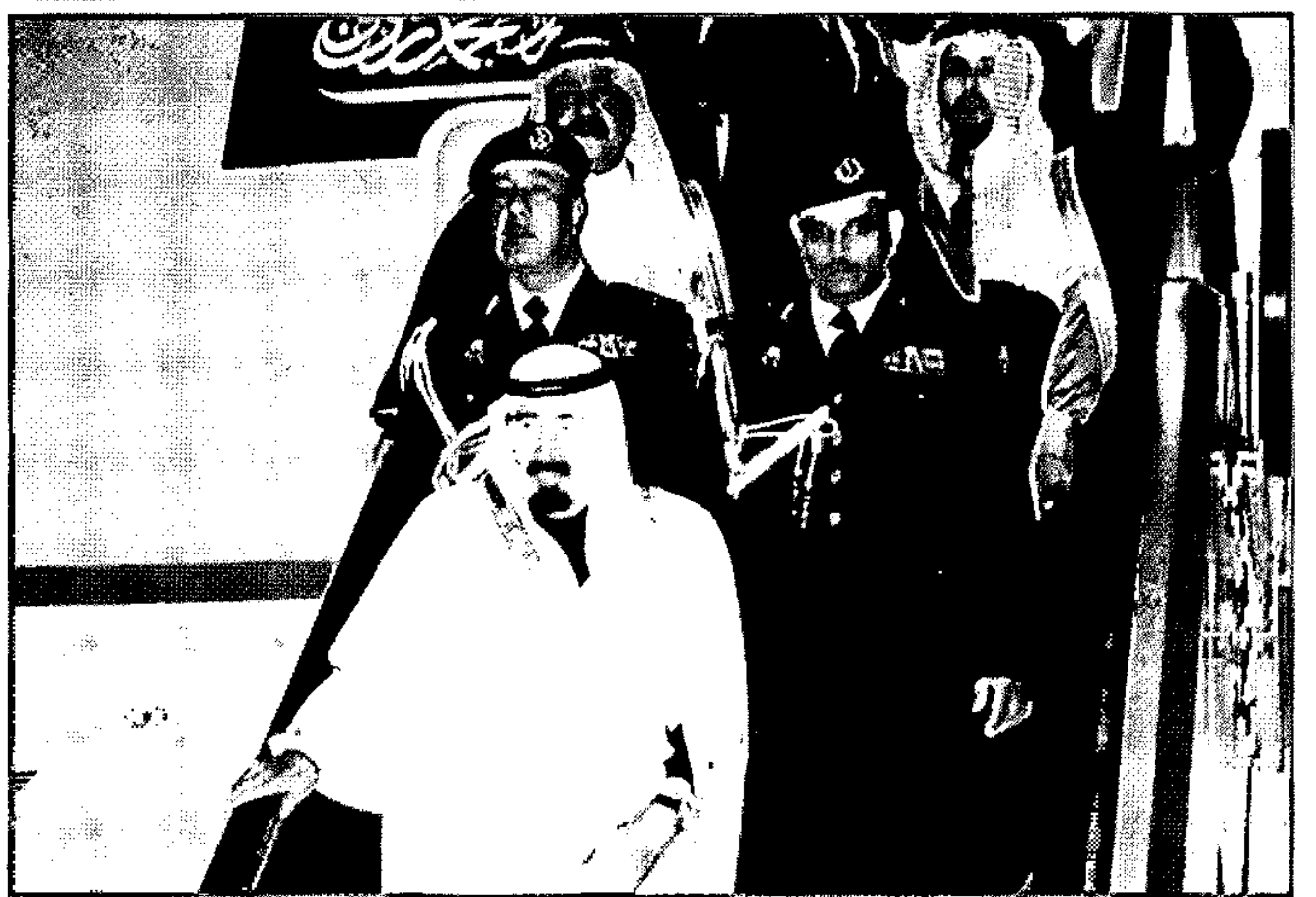
بعد أن رأس وفد المملكة في مؤتمر قمة مجلس التعاون الخليجي