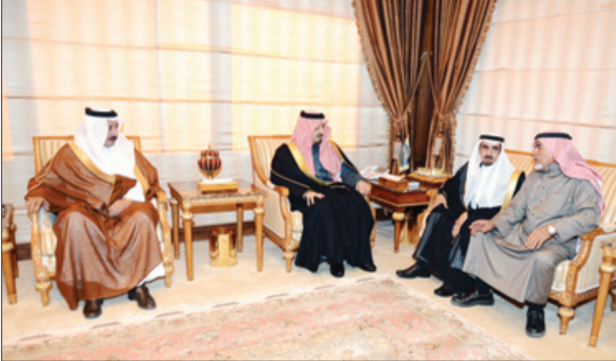
الأمير فيصل بن خالد خلال استقباله المواطن عوض الشهري

وتم خلال اللقاء بحث تعزيز برامج التعاون بين الهيئة والوزارة بما يحقق توجهات خادم الحرمين الشريفين الملك سلمان بن عبدالعزيز (حفظه الله) بتعزيز وعي المواطن تجاه تاريخ وتراث بلاده، وإطلاعه على ما يتحقق من منجزات حضارية على أرض الواقع.