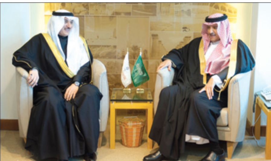
الأمير فيصل بن خالد خلال استقباله المواطن عوض الشهري

وقد عبر رئيس الهيئة عن تقديره للشراكة الفاعلة والمتميزة التي تربط الهيئة بالوزارة في عدد من المسارات التي تستهدف في مجملها دعم برامج السياحة الداخلية، وتعزيز الهوية الوطنية وزيادة معرفة المواطن ببلاده والحضارات العظيمة التي تقف عليها، وتعميق علاقته بها من خلال البرامج والأنشطة الإعلامية والثقافية، وذلك في إطار اتفاقية التعاون