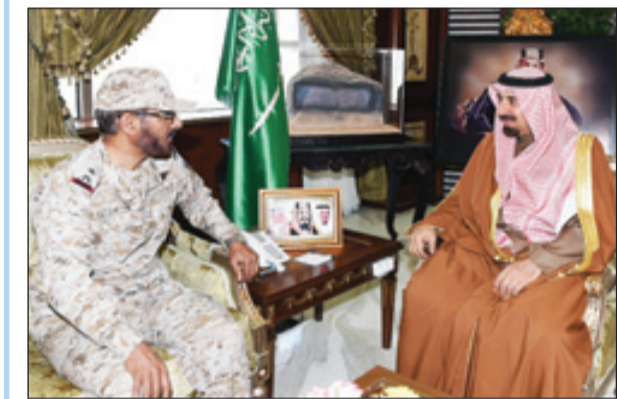
أمير نجران يستقبل قائد المنطقة الجنوبية