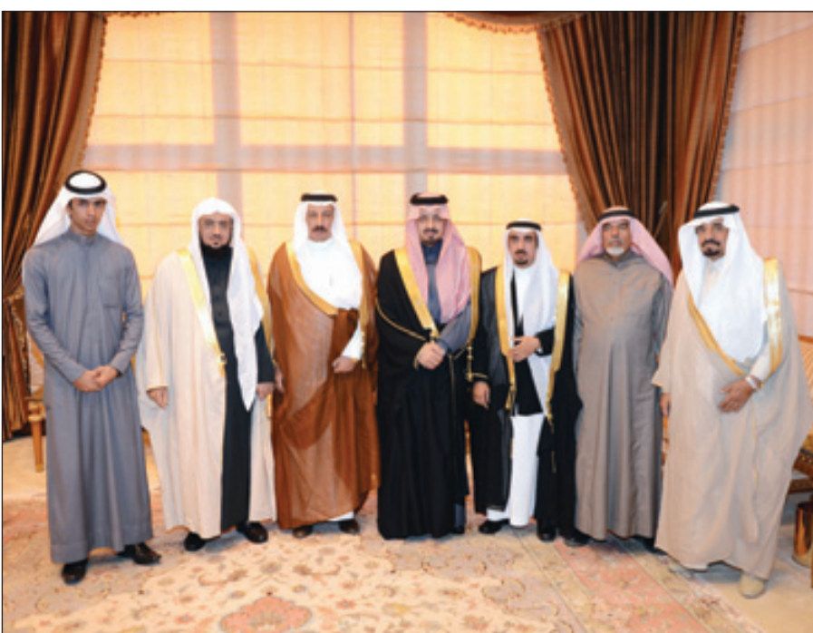
سموه يتوسط الشهري والشبيلي وأمين لجنة إصلاح ذات البين فحاس.

أبها - يحيى الشبرقي ■ أتى صاحب السمو الملكي الأمير فيصل بن خالد بن عبدالعزيز أمير منطقة عسير على ما قام به المواطن عوض بن عون الشهري بتنزله عن قاتل ابنه ماجد لوجه الله سبحانه ثم لشفاعه خادم الحرمين الشريفين الملك عبدالله بن عبدالعزيز -رحمه الله- وشفاعه سمو أمير المنطقة.