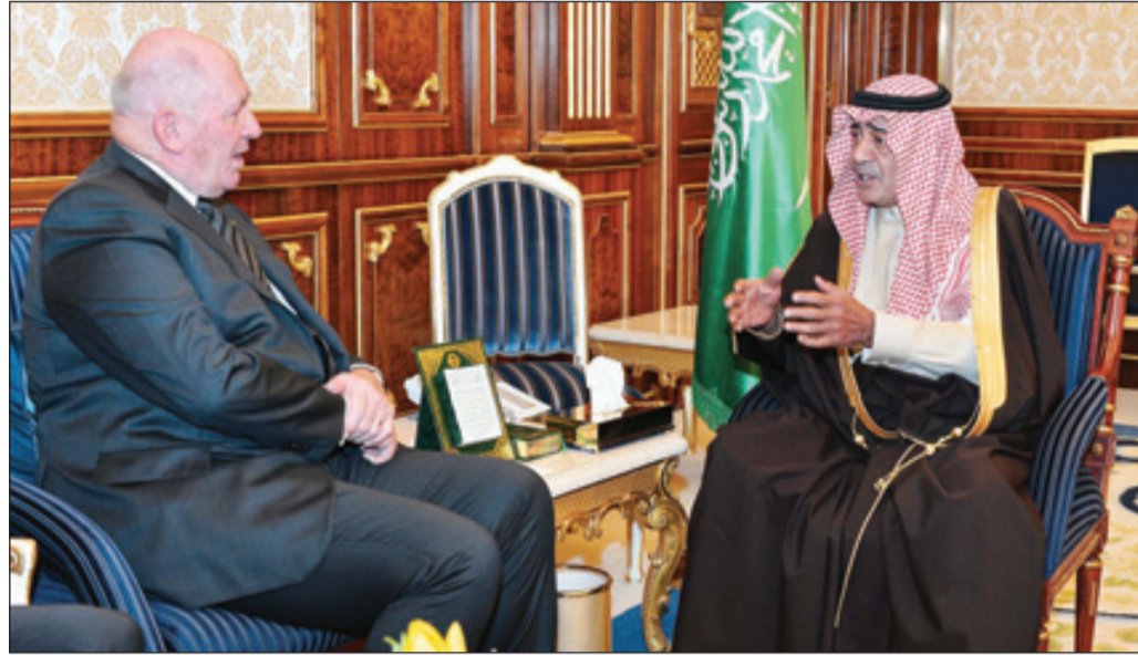
الأمير مقرن بعث مع الجنرال بيتر كوسغروف تهنئة العلاقات

أل سعود رحمه الله. وعبر عن تهنئته لصاحب السمو الملكي الأمير مقرن بن عبدالعزيز آل سعود ولي العهد نائب رئيس مجلس الوزراء بمناسبة مباحثته ولينا للعهد.