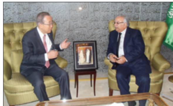
بان كي مون في حديث مع السفير المعلمي