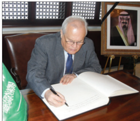
سفير النمسا يدون تعازيه