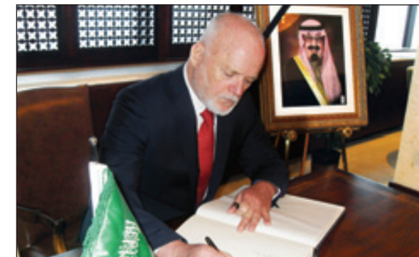
نائب مندوب كندا لدى الأمم المتحدة يكتب كلمة في سجل التعازي