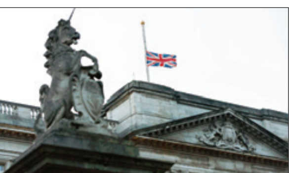
أعلام تركيا والمملكة المتحدة كما بدت منكسة عند إعلان الوفاة

إجراءات حداد على فقدانه في ظاهرة استثنائية لم يسبق حدوثها. ولعل أكبر دليل على المكانة التي تتبوأها رحمه الله على مستوى العالم، هو ذلك الحشد الكبير من قادة ورؤساء العالم الذين ما ان سمعوا بالخبر الجلل حتى تقاطروا إلى المملكة تسبقهم برقيات التعزية على رحيل هذا الرجل الفريد. كما هو الحال بالنسبة للرئيس المصري السابق المستشار عدلي منصور الذي لم يتمالك نفسه ليكي على الهواء وهو ينعي القائد الراحل، وكذلك الحال بالنسبة لأكثر من رجل سياسة وزعيم عالمي ظهرت على محياه مشاعر الحزن والألم. هذا الألم الذي لم يطل المقربين من الملك عبدالله -رحمه الله- فقط وإنما طال معظم شرائح المجتمع للإعلاميين والمفكرين والمثقفين والصحافيين والفنانيين. ان من راقب وتابع الحراك الذي شهده العالم بعد رحيل القائد العربي وتفاعل الدول على المستويين