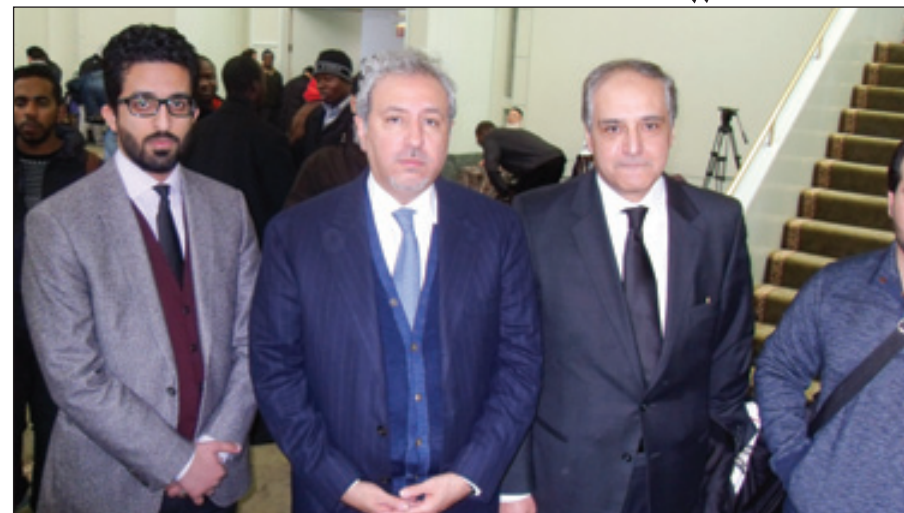
التفصل الشريف مع العزيمين

بارغواي، فإنني أعبر عن عميق تعازينا في وفاة الملك عبدالله بن عبدالعزيز، الذي كان حقاً زعيماً كبيراً في الشرق الأوسط ودعم باستمرار وناصر عملية السلام في المنطقة. كما قام بإصلاحات عديدة في المملكة ولذا فحنن ممتنون لكل ما قام به وحزنون على رحيله. والملك سلمان بن عبدالعزيز سيواصل العمل الذي كان يقوم به الملك الراحل والعالم والمنطقة يمتنون كثيراً للملك سلمان على قيامه بذلك. أما مندوب النمسا لدى الأمم المتحدة فقال لـ"الرياض" عن وفاة خادم الحرمين الملك عبدالله بن عبدالعزيز: "بحضور رئيس وزراء النمسا مراسم جنازة الملك عبدالله بن عبدالعزيز فإن ذلك يؤكد على مدى عمق مشاعر الحزن على الملك الراحل وعمق علاقته هو شخصياً، وقد كان صديقاً لبلادنا بل صديقاً حقيقياً منذ العديد من السنوات. وقد اختار الملك عبدالله فيينا مقراً لإقامة مركز الملك عبدالله لحوار الأديان. ونحن نتطلع إلى استمرارية علاقات الصداقة بين بلدينا. ونحن نرى في تولى الملك سلمان بن عبدالعزيز القيادة بمثابة تأكيد جديد على استمرارية علاقات الصداقة التي تنشدها بين بلدينا." وقالت مندوبية فيتنام لدى الأمم المتحدة لـ"الرياض": "إن وفاة الملك عبدالله بن عبدالعزيز تعد خسارة كبيرة