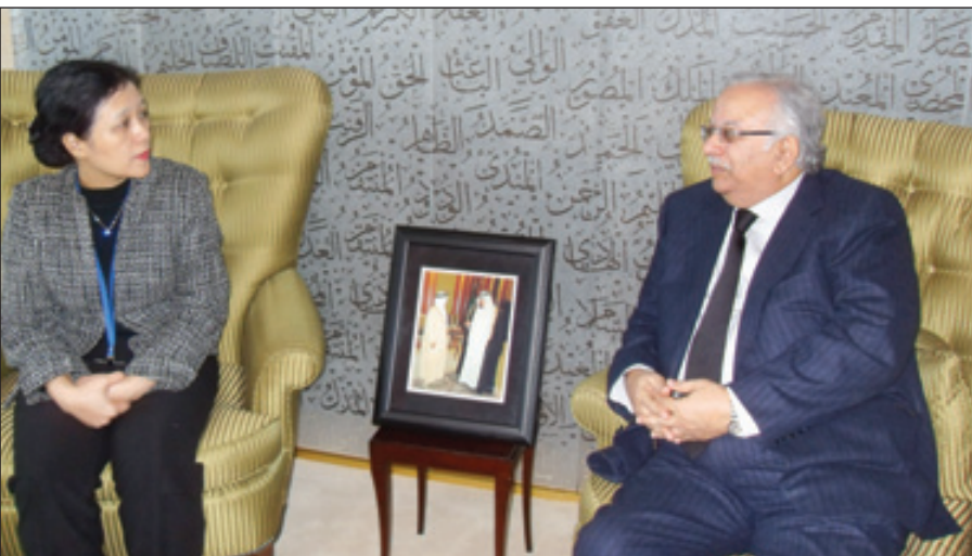
السفير المعلمي يتحدث إلى مندوب فيتنام