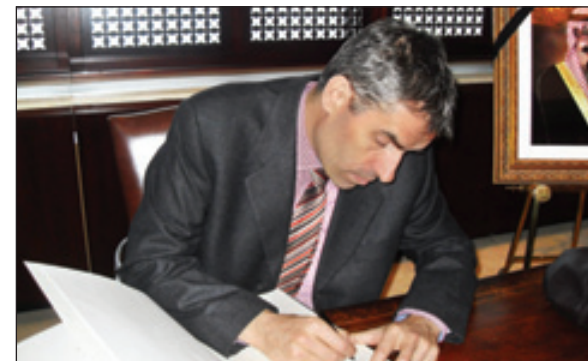
مندوب بارغواي في مقر وفد المملكة