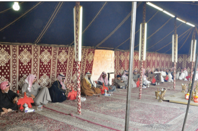
الشيخ عبدالله بن حزام آل خرسان