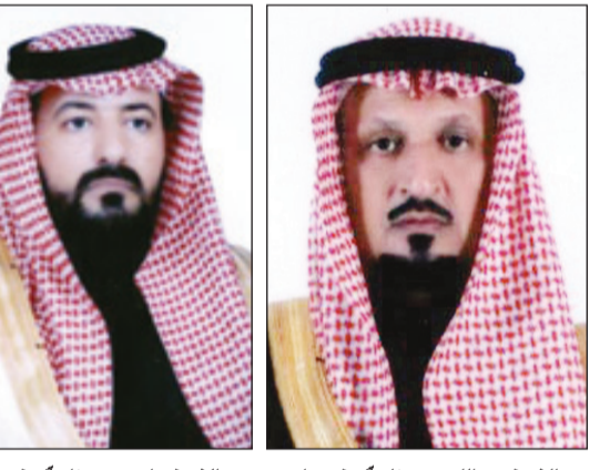
الشيخ عبدالله بن حزام آل خرسان