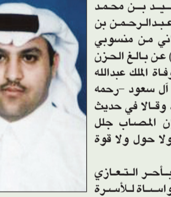
عبر وليد بن محمد الحقباني وعبدالرحمن بن محمد الحقباني من منسوبي بلدية الدلم) عن بالغ الحزن والأسى في وفاة الملك عبدالله بن عبدالعزيز آل سعود -رحمه الله تعالى-، وقال في حديث لـ «الرياض» إن المصاب جليل والفقد عظيم ولا حول ولا قوة إلا بالله.

الحربية: لقد أكني سماع نبأ وفاة خادم الحرمين الذي لم يفقده الشعب السعودي فقط بل الأمتان العربية والإسلامية حيث عرف عنه التواضع وقربه من الشعب وحبه للعلماء وداثماً في حديثه يذكر ويحث على الدين والتمسك بالعقيدة وكان يكره أن يلقب بمولاي أو ملك الإنسانية بل يفرح بخادم الحرمين الشريفين ومن حسن خاتمته وفاته ليلة الجمعة، وروي عن الرسول قوله ما من مسلم يموت يوم الجمعة أو ليلة الجمعة إلا وقاه الله فتنة القبر. فرحم الله خادم الحرمين الشريفين عبدالله بن عبدالعزيز.