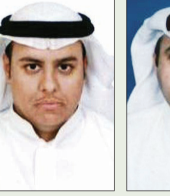
وليد بن محمد الحقباني

كما عبر ناجي الحقباني ومجاد الحقباني وسلطان الحقباني عن حزنهم العميق وتأثرهم الكبير لوفاة الملك عبدالله، وقالوا: لقد خسر الوطن قائداً عظيماً ومحنكاً استطاع أن يقود البلاد بكل حكمة واقتدار، وكذلك قيامه -رحمه الله- بأعمال جليلة تستحق له بأحرف من ذهب وأشهرها التوسعة العظيمة للحرمين الشريفين التي أبهرت العالم الإسلامي وطباعة المصحف الشريف. فرحمه الله رحمة واسعة وجزاه الله خير الجزاء على ما قدمه لأبناء شعبه وأمته ويجعله في موازين حسناته.