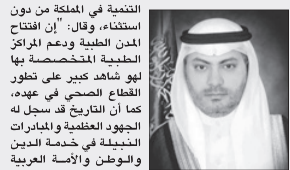
د. محمود اليمني

التنمية في المملكة من دون استثناء، وقال: "إن افتتاح المدن الطبية ودعم المراكز الطبية المتخصصة بها لهو شاهد كبير على تطور القطاع الصحي في عهده، كما أن التاريخ قد سجل له الجهود العظيمة والمبادرات النبيلة في خدمة الدين والوطن والأمة العربية والإسلامية ورفعة وعة أبناء شعبنا الذين كانوا أولى اهتماماته".