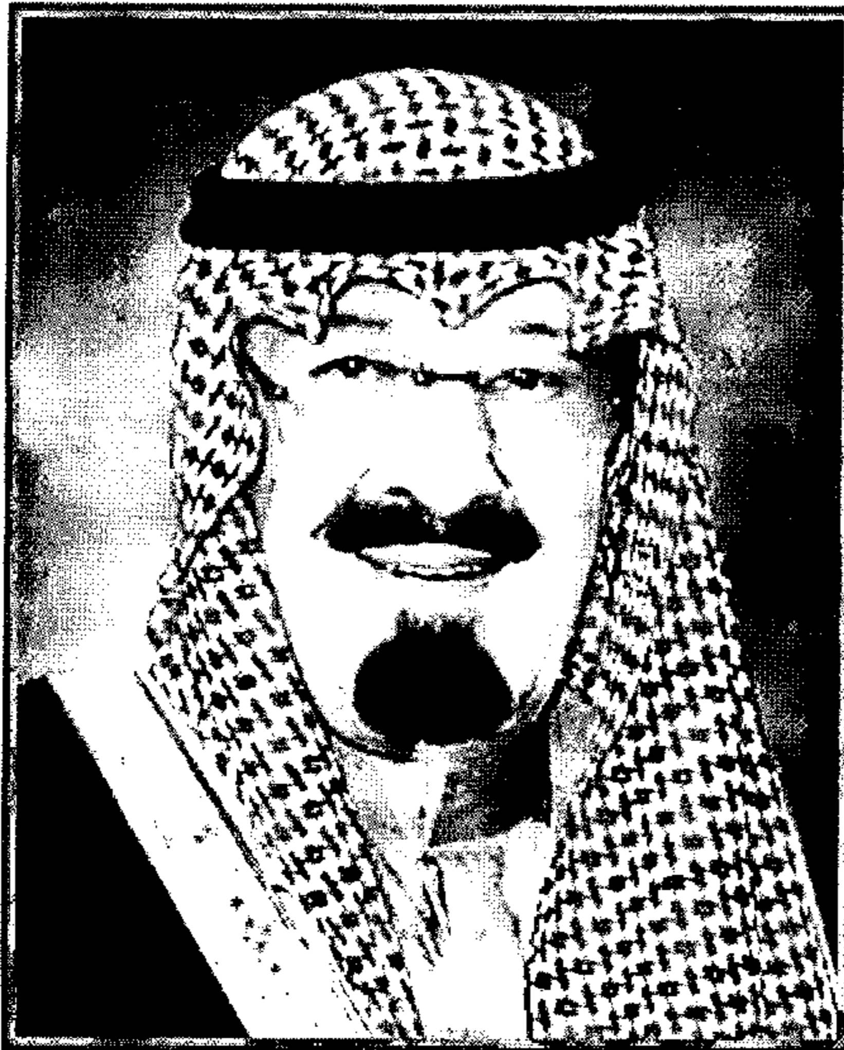
تفاصيل ص ٦٦

الملك يأمر بتمديد خدمة (٧) من شاغلي المرتبة الممتازة أربع سنوات الأمير فيصل بن عبد الله وزيراً للتربية والتعليم الشيخ صالح بن حميد رئيساً للمجلس الأعلى للقضاء الشيخ عبد الرحمن بن عبد العزيز الكلية رئيساً للمحكمة العليا الشيخ عبد الله بن إبراهيم آل الشيخ رئيساً لمجلس الشورى الشيخ محمد بن عبد الكريم العيسى وزيراً للعدل الدكتور عبد العزيز خوجه وزيراً للثقافة والإعلام الدكتور عبد الله الربيعة وزيراً للصحة