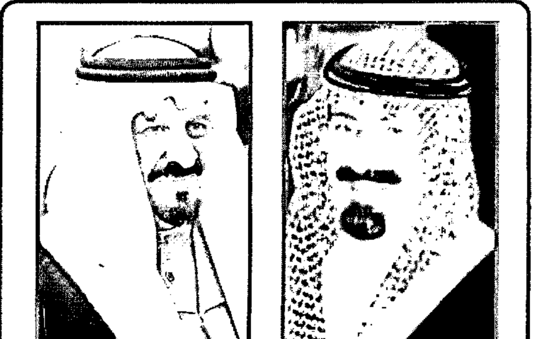
بمناسبة ذكرى يوم الاستقلال واليوم الوطني

الرياض - واس تلقى خادم الحرمين الشريفين الملك عبدالله بن عبدالعزيز آل سعود - حفظه الله - اتصالاً هاتفياً مساء يوم الخميس ١٧ صفر ١٤٣٠ هـ الموافق ١٢ فبراير ٢٠٠٩ م من فخامة الرئيس إسماعيل عمر جيله رئيس جمهورية جيبوتي. وجرى خلال الاتصال استعراض العلاقات الثنائية بين البلدين الشقيقين بالإضافة إلى بحث عدد من القضايا الدولية والإقليمية الراهنة. كما تلقى خادم الحرمين الشريفين الملك عبدالله بن عبدالعزيز آل سعود اتصالاً هاتفياً مساء يوم الجمعة ١٨ صفر ١٤٣٠ هـ الموافق ١٣ فبراير ٢٠٠٩ م من أخيه فخامة الرئيس محمد حسني مبارك رئيس جمهورية مصر العربية. وجرى خلال الاتصال إلى العلاقات الأخوية بين البلدين الشقيقين ■