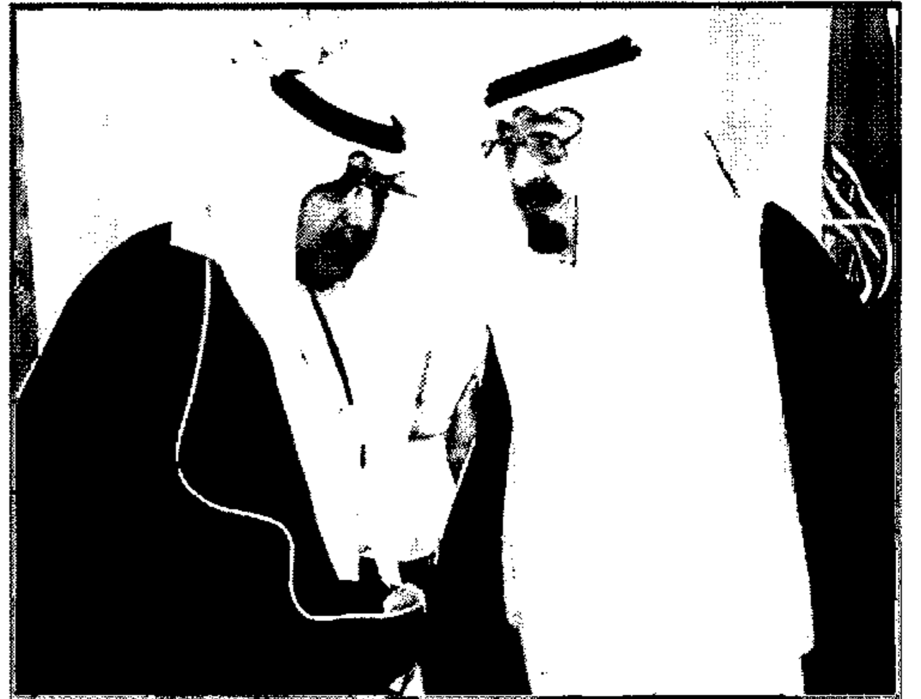
وزراء التربية والتعليم والثقافة والإعلام والصحة يتشرفون بالسلام على خادم الحرمين الشريفين