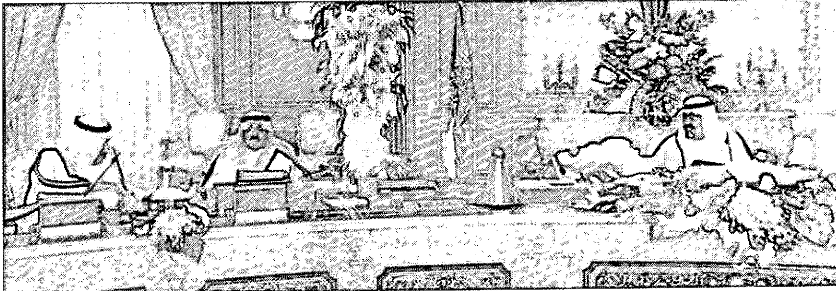
رأس جلسة مجلس الوزراء

خادم الحرمين الشريفين يصدر أوامره بإعفاء (١٩٢٠) مقترضاً • • • • • سمو النائب الثاني يرضى حفل خريجي مدينة تدريب الأمن العام