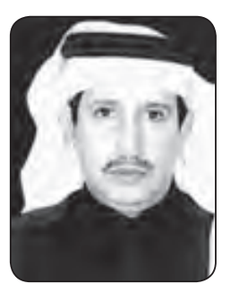
سعود سيف الجعيد

وهاهو قلمي قد أخذ على عاتقه حمل أمانة الكلمة الصادقة وهاهو ذا يرثي الحبيب وها هو قلمي يكتب ويسطر محبتي الصافية ومشاعري الجياشة التي لا تصدأ فبعد الغياب لظلما يحط الفكر رحاله ليتذكر من كان لنا بالأمس ملكاً. رحم الله ملكنا الغالي فكم أفنى أيامه والليالي ساهورا لأجل شعبه ونيل المعالي في كد وشغل لخدمة دينه ووطنه الغالي. نحن نعلن أنه لا أحد مخلصاً ولكن موت العظام من الرجال من عظيم المصاب ولقد نعي الوطن ملكاً رجلاً شهماً كريماً رحيماً مؤمناً مقداماً محارباً للفساد معينا بتوفيق الله للعباد.