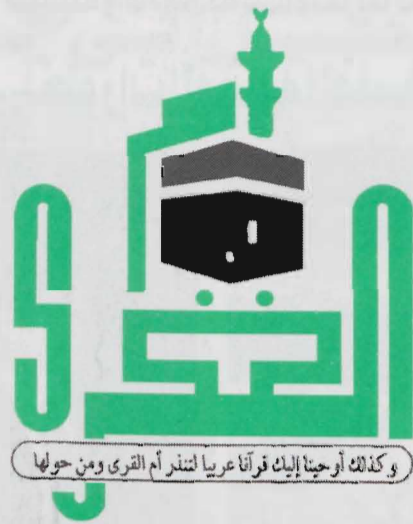
وكذلك أوجبت إلبك قرناً عربياً لتنتشر أم القرى ومن حولها