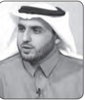
د. محمد بن عبدالعزيز المحمود

في الإسلام، وثمرة من ثمار تحكيم شرع الله في المجتمع. والبيعة التي رأيناها تمثل حدثاً عظيماً في تاريخ المملكة دينياً وتاريخياً وحضارياً.