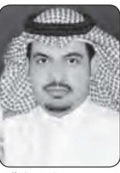
منصور شافي الشلاقي

صدقا... لا كذبا ولا رياء... تنهمر حزناً على رحيله إلى الدار الآخرة، ووفاته هي فاجعة وطن... بل هي فاجعة العالم بأكمله الذي حزن حزناً شديداً على رحيله لما له من تأثير كبير في الشأن العربي والدولي. وحينما نود أن نذكر أو نعدد إنجازاته لوطنه، فيصعب المجال، لأنه صاحب الإنجازات والإصلاحات في عهده في جميع المجالات التعليمية والأمنية والطرق والإسكان والضمان الاجتماعي، وغيرها. ونعلم إنه أفنى حياته في الدفاع والتصدي لقضايا الأمتين العربية والإسلامية منذ أن كان ولياً للعهد حتى وافته الأجل المحتوم. ولا ننسى كمواطنين سعوديين كلمته للشعب السعودي في أحد خطاباته حينما قال (يعلم الله أنني في قلبي وأستمد العون من الله ثم منكم)، فهي كلمات أروع خرجت من القلب للقلب ولا تزال أصدأؤها باقية. رحم الله الملك عبدالله بن عبدالعزيز وأسكنه فسيح جناته... وإنا لله وإنا إليه راجعون.