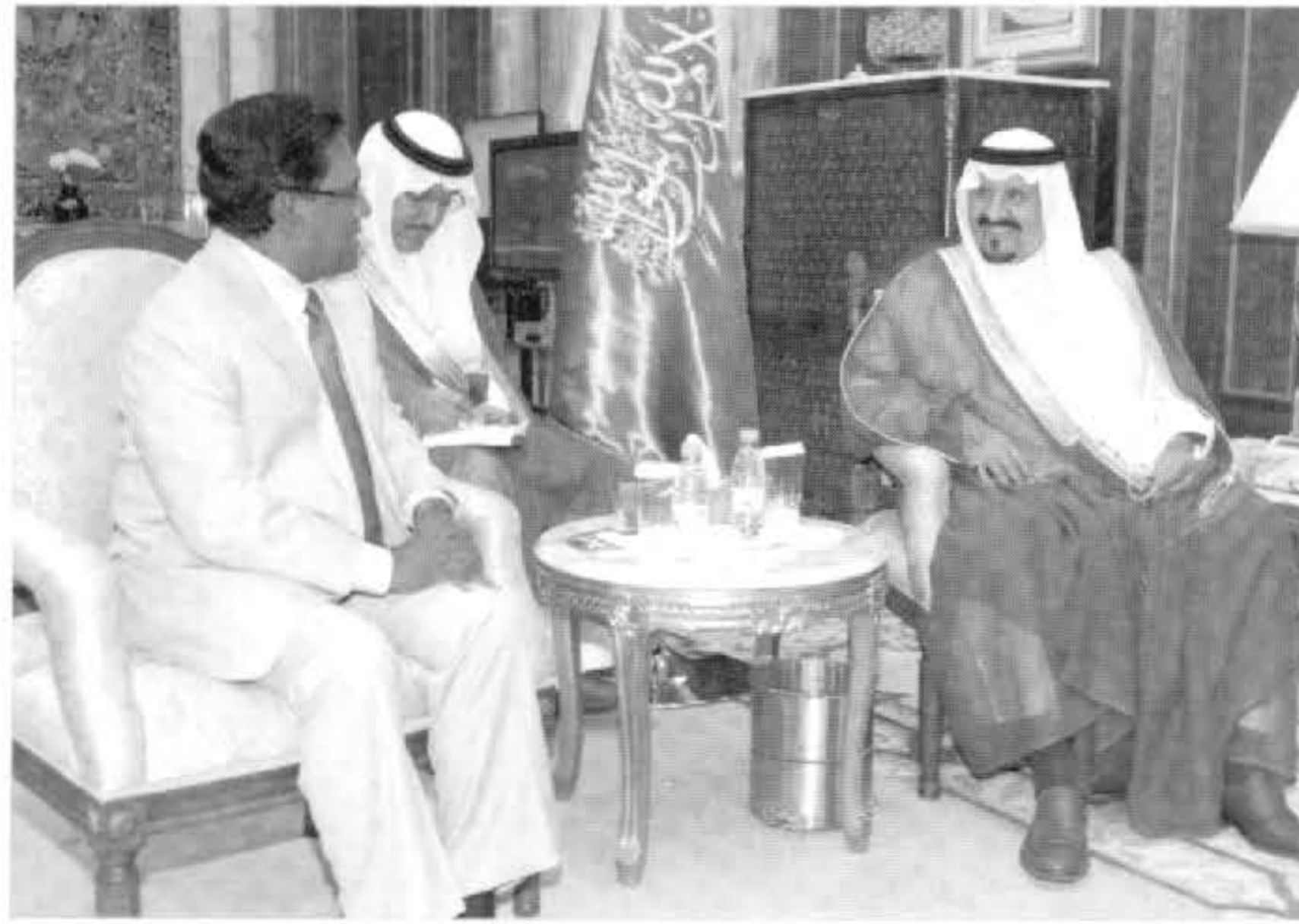
فخامة الرئيس محمد ناشيد رئيس جمهورية المالديف فيما حمله - رعاه الله - تحياته وتقديره لفخامته .

كما استقبل صاحب السمو الملكي الأمير سلطان بن عبدالعزيز آل سعود ولي العهد ونائب رئيس مجلس الوزراء وزير الدفاع والطيران والمفتش العام في قصر سموه العزيزية يوم الأحد ٥ ربيع الآخر ١٤٣١ هـ