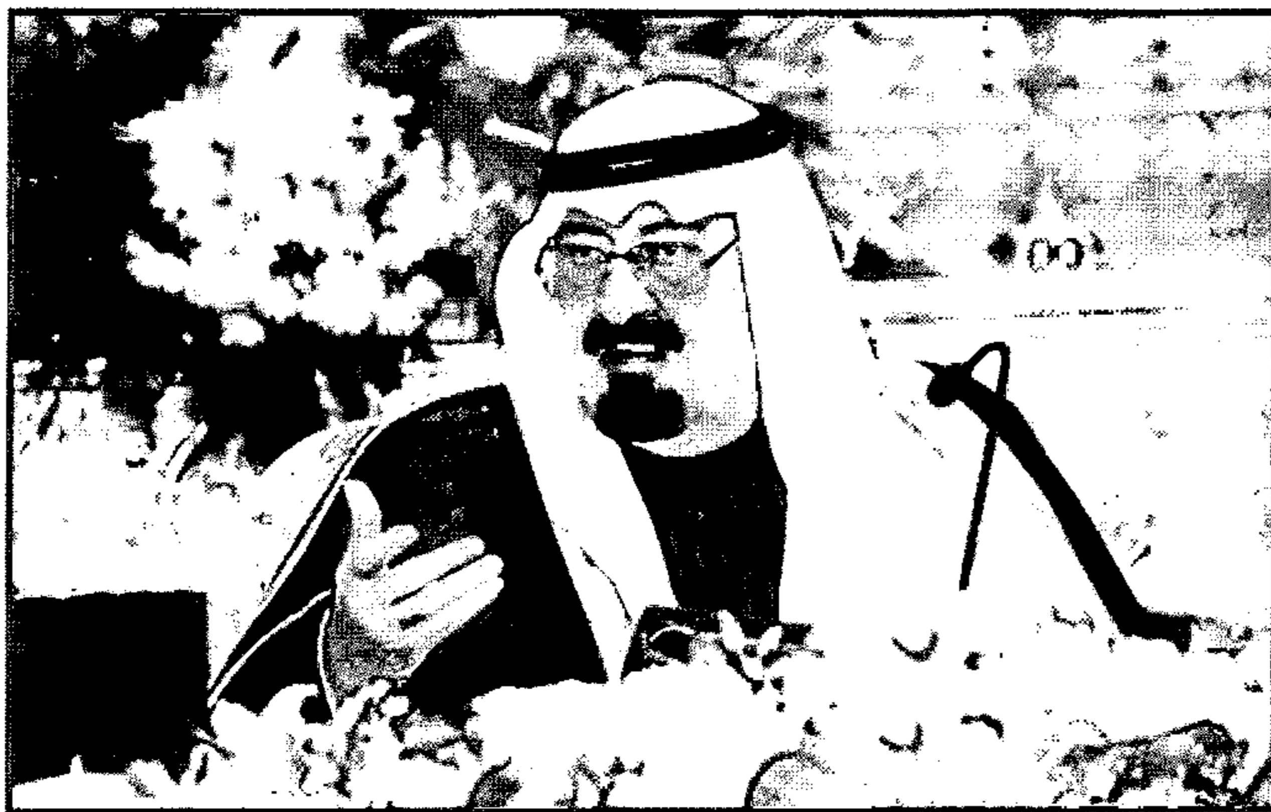
الرياض - واس

الرياض - واس رأس خادم الحرمين الشريفين الملك عبد الله بن عبدالعزيز آل سعود - حفظه الله - الجلسة التي عقدها مجلس الوزراء بعد ظهر يوم الاثنين ١٢ ربيع الأول ١٤٣٠ هـ الموافق ٩ مارس ٢٠٠٩ م في قصر اليمامة بمدينة الرياض. وفي مستهل الجلسة ثمن المجلس المضامين القيمة التي اشتملت عليها كلمات خادم الحرمين الشريفين - أيده الله - خلال استقباله لسماحة مفتي عام المملكة