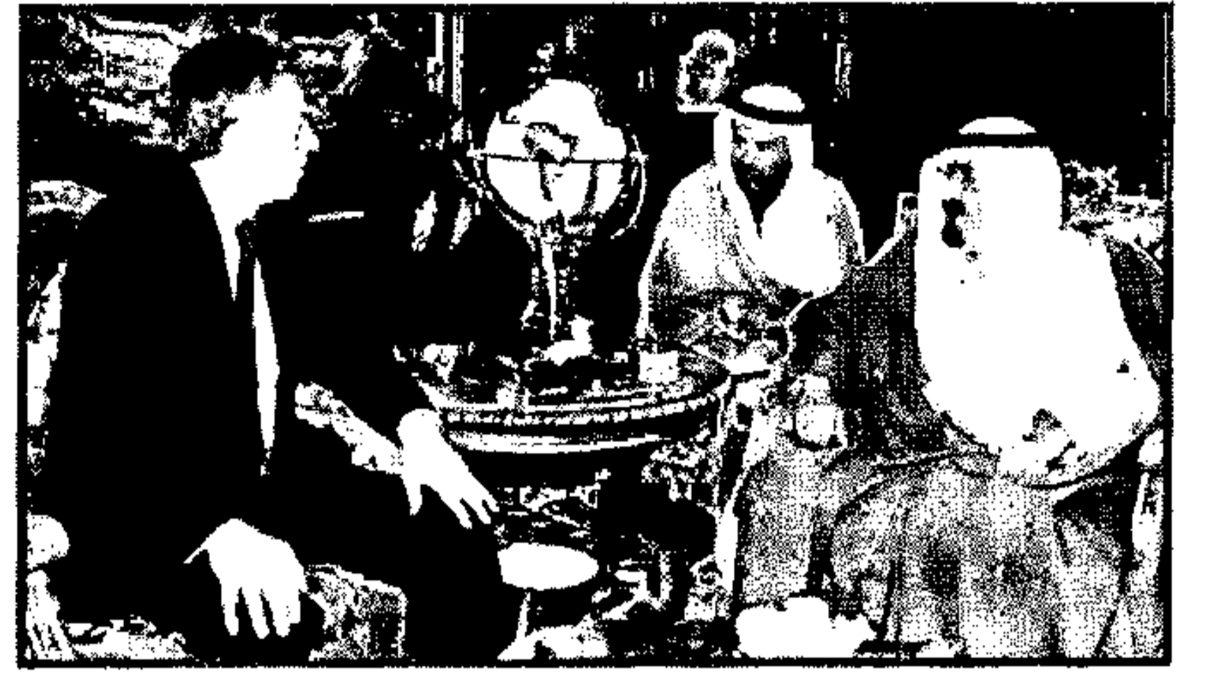
الرياض - واس

استقبل خادم الحرمين الشريفين الملك عبدالله بن عبدالعزيز آل سعود - حفظه الله - بقصره بالرياض مساء يوم السبت ٢٠ محرم ١٤٣٠ هـ الموافق ١٧ يناير ٢٠٠٩ م دولة رئيس الوزراء البريطاني السابق مبعوث اللجنة الرباعية الدولية الخاص إلى الشرق الأوسط توني بلير.