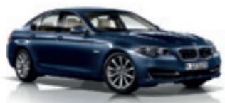
أريج واحدة من 6 سيارات BMW