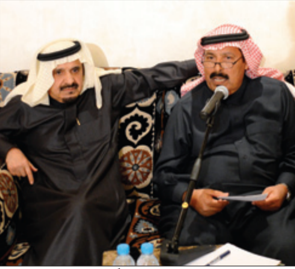
الحميدي والقاضي تحدثا عن مآثر الملك عبدالله