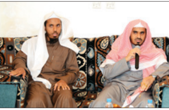
أبناء د. الجريد تحدثوا عن تطوير القضاء