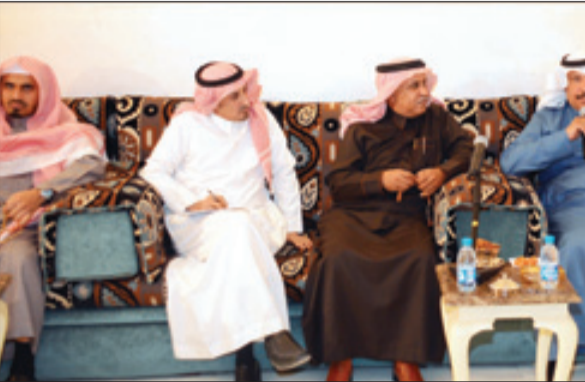
الزميل الريمي، والمحرم السكران متحدثا