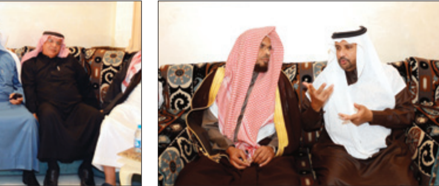
د. الحمودي و د. الجريد تحدثا عن الملك السلف والملك الخلف