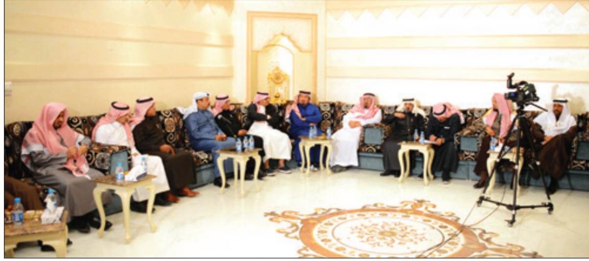
مفكرون وأدباء حضروا الاثنيية