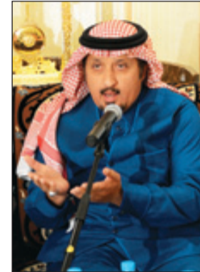
المهندس الزامل تناول الجوانب التنموية