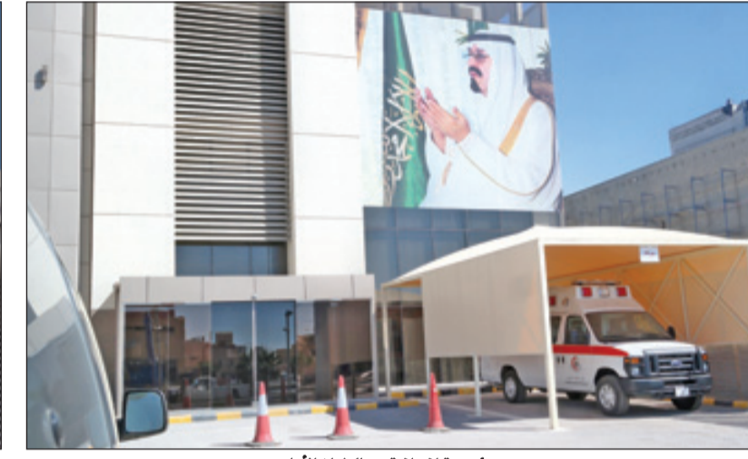
مؤسسة إنسانية من الطراز الأول