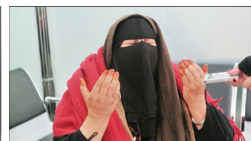
دليل محمد، تذكر مآثره

الرياض - أسهمان الغامدي، عدسة - منيرة السليم رجل حمل الإنسانية في داخله منذ نعومة أظفاره، كسب محبة ملايين البشر للحد الذي أنهل به العالم، ضجت الصحف المحلية والعربية والغربية بخبر وفاته، شارك الشعب والعالم كله بتأبين رجل ملك قلوب الجميع بطيبته وبساطته وعفويته، كان يتعامل بعفوية مطلقة بلا تكلف، يعامل الجميع كأبنائه، لم يخجل من إظهار دمعائه لفراق حبيب أو حال شخص كسيف، عرفه الجميع بملك الإنسانية.