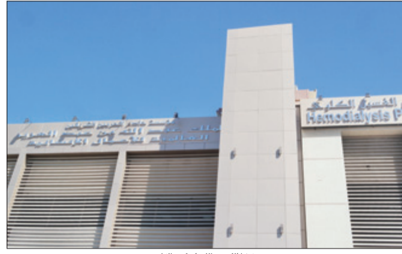
مركز الملك عبدالله لمرضى الكلى