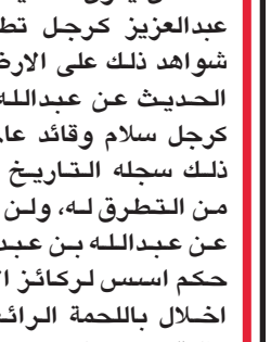
د.عبد الجبار بن محمد الجلال

الهدف والمصير فهو رجل يؤمن بأن الإسلام هو الرابط القوي والدعاة الصلبة لوحدة الأمة العربية تحقيق ذلك الهدف قام بكثير من المحاولات لاحتواء الخلافات، وتقريب وجهات النظر، فلم يتجزأ دولة عربية إلا زارها وما فتئ يقدم كل المساعدات المختلفة إلى بعض الدول الإسلامية. كما قام بالعديد من الزيارات لكثير من الدول الصديقة في العالم لتوطيد ودعم جمعة المملكة العربية السعودية مع جميع الدول الصديقة، كما رأس وفد المملكة في العديد من المؤتمرات الخليجية