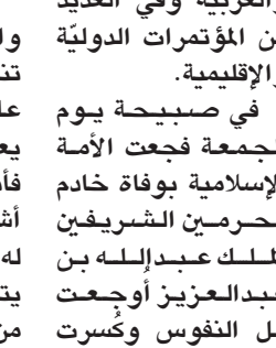
عائض آل رفدة

يعلم الله انكم في قلبي أحلمكم واستمد قوتي من الله ثم منكم فلا تنسوني من دعواتكم" رحمة الله عليك يا أبا متعب وغفر الله لك يعلم الله كم نحبك، يا ملكنا الغالي، فأنت في القلوب ساكن وفي الحدايق أشجار وارقة بإذن الله، مدنا بالكثير، له حب لا يضاويه حب نسأل الله أن يتجاوز عنه وان يجعل قبره روضة من رياض الجنة. ومن هذا الصرح ينباع خادم الحرمين الشريفين الملك سلمان بن عبدالعزيز وولي عهده صاحب السمو الملكي الأمير مقرن بن عبدالعزيز آل سعود وولي ولي العهد صاحب السمو الملكي الأمير محمد بن نايف آل سعود ونعاهدهم على السمع والطاعة ونسأل الله العليم أن يوفقهم لما فيه الخير للإسلام والمسلمين. العربية وفي العديد من المؤتمرات الدولية والإقليمية. في صبيحة يوم الجمعة فجعت الأمة الإسلامية بوفاة خادم الحرمين الشريفين الملك عبدالله بن عبدالعزيز أوجعت كل النفوس وكسرت القلوب بهذه الفاجعة، تغمد الله خادم الحرمين الشريفين الملك عبدالله بن عبدالعزيز بواسع رحمته وغفرانه وأسكنه فسيح جناته، وعزأونا تمسك هذه الأمة بدينها القويم، فجزاه الله عن الإسلام وعن هذه الأمة وعن المسلمين كافة خير الجزاء. أذكركم بمقولته الشهيرة: