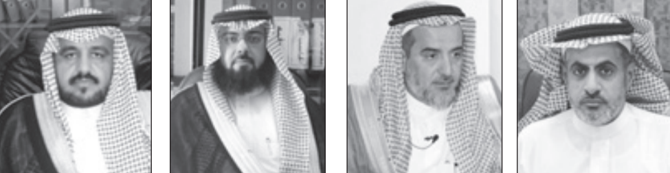
عبدالله العثيمين / فهد ابن منيع / ناصر ابن هميل / مقعد ابن نعيص

وفي السياق نفسه قال رئيس بلدية رنية عايض بن حزام السبيعي: "ببالغ الأسى والحزن تلتقيت نبأ وفاة خادم الحرمين الشريفين الملك عبدالله، ونجدد لخادم الحرمين الشريفين الملك سلمان بن عبدالعزيز آل سعود وسمو ولي العهد الأمير مقرن بن عبدالعزيز آل سعود وسمو ولي عهده