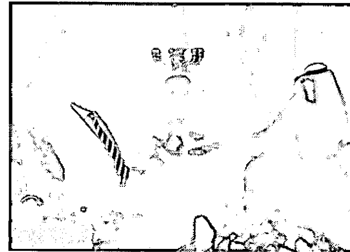
الرياض - واس

استقبل خادم الحرمين الشريفين الملك عبدالله بن عبدالعزيز آل سعود - حفظه الله - في مكتبه بالديوان الملكي في قصر اليمامة اليوم نفسه المديرة