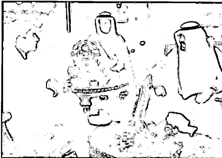
الرياض - واس

حضر الاستقبال صاحب السمو الملكي الأمير سعود الفيصل وزير الخارجية والقائم بأعمال سفارة خادم الحرمين الشريفين لدى هولندا فهد بن معيوف الرويلي وسفير هولندا لدى المملكة رون ستريكر