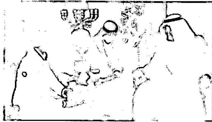
بن محيي الدين خوجه ومعالي مستشار خادم الحرمين الشريفين الأستاذ عبد المحسن بن عبدالعزيز التوجيري وسفير فرنسا لدى المملكة بيرتراند بينزانسنو

حضر الاستقبال صاحب السمو الملكي الأمير مقرن بن عبدالعزيز رئيس الاستخبارات العامة وصاحب السمو الملكي الأمير منصور بن ناصر بن عبدالعزيز مستشار خادم الحرمين الشريفين وصاحب السمو الأمير الدكتور بندر بن سلمان بن محمد آل سعود مستشار خادم الحرمين الشريفين وصاحب السمو الملكي الأمير عبدالعزيز بن فهد بن عبدالعزيز وزير الدولة عضو مجلس الوزراء رئيس ديوان رئاسة مجلس الوزراء ومعالي وزير المالية الدكتور إبراهيم بن عبدالعزيز العساف ومعالي وزير الثقافة والإعلام الدكتور عبدالعزيز