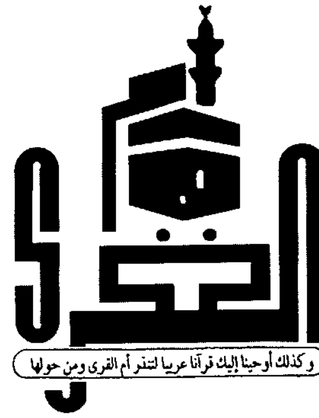
وكذلك أوحينا إليك قرآنا عربيا لتنذر أم القرى ومن حولها

الأجزاء ٥٥ صفحة ٦٠ • الثمن ٣ ريالات سعودية